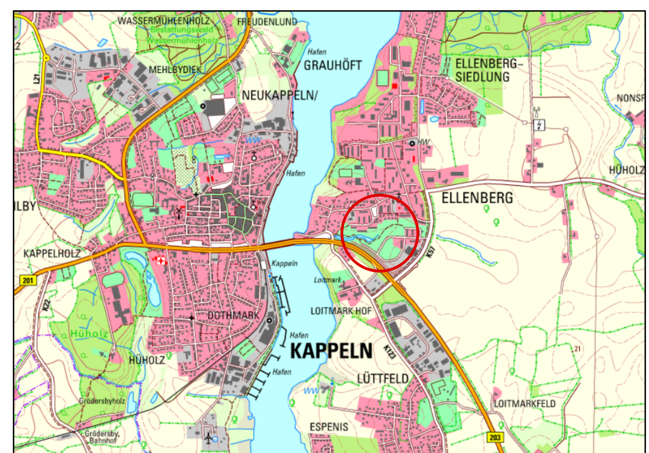
Übersichtsplan M 1:25 000

Aufgrund des § 10 des Baugesetzbuchs (BauGB) in der Fassung vom 3. November 2017 (BGBl. I S. 3634) wird nach Beschlussfassung durch die Stadtvertretung vom ..... folgende Satzung über den Bebauungsplan Nr. 1 - 11. Änderung "Ellenberg - Wohnbebauung an den Regenrückhaltebecken" für das Gebiet nördlich ..... und westlich ..... bestehend aus den Flurstücken ..... (teilweise) und ..... (teilweise) und ..... (teilweise), bestehend aus der Planzeichnung (Teil A) und dem Text (Teil B), erlassen: