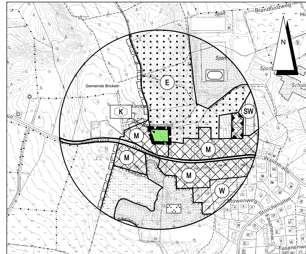
Kreis Dithmarschen, Gemeinde und Gemarkung Burg - Flur 1

© GeoBasis-DE/L VermA-SH (www.lverma.schleswig-holstein.de)