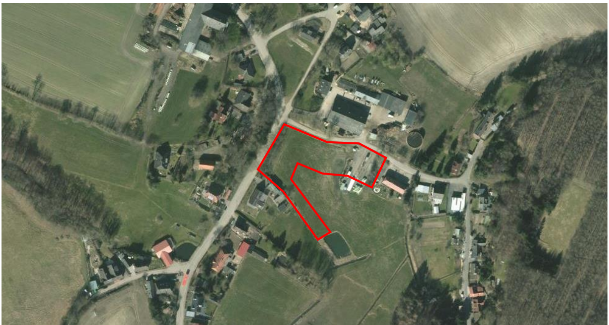
Abb.: Ausschnitt Luftbild mit Einbeziehungsbereich

Im Ortsteil Liensfeld besteht der Wunsch den im Zusammenhang bebauten Bereich um vier bis fünf weitere Baugrundstücke zu arrondieren. Die Gemeinde unterstützt das Vorhaben und nimmt dies zum Anlass, mit einer Satzung nach § 34 Abs. 4 Nr. 1 und 3 BauGB (Klarstellungs- und Ergänzungssatzung) für die Ortschaft Liensfeld für einen Bereich am östlichen Ortsrand die Grenzen der im Zusammenhang bebauten Ortsteile festzulegen und diese Fläche einzubeziehen.