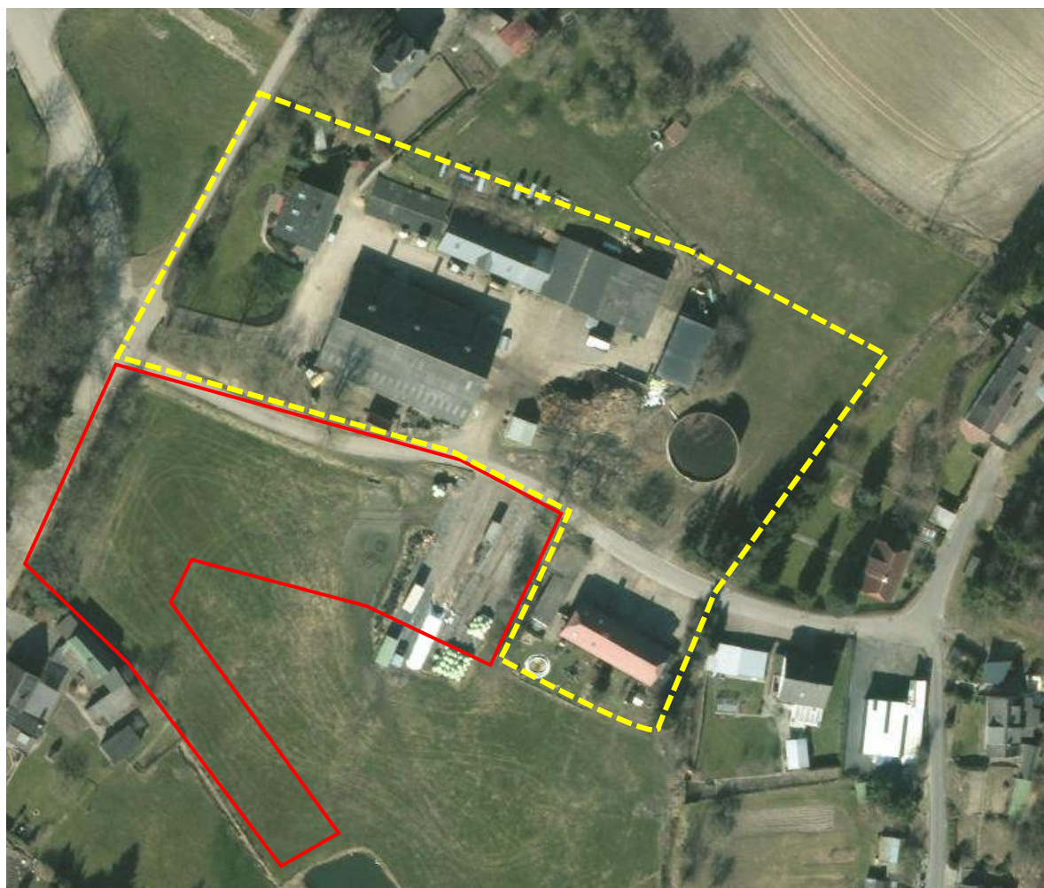
Abb.: Ausschnitt Luftbild mit Einbeziehungsbereich und Klarstellungsbereich

Der Ortsteil Liensfeld liegt mittig im Gemeindegebiet von Bosau. Durch den Ort führt die Kreisstraße 6.