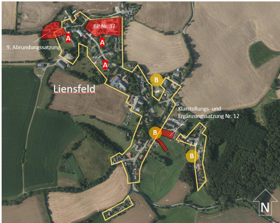
Abb.: Ausschnitt Luftbild mit Flächenpotenzialen, Digitaler Atlas Nord