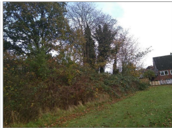
Foto 2: Blick auf Geländehang mit Gehölzbestand, Blickrichtung Nordost (05.11.2020).