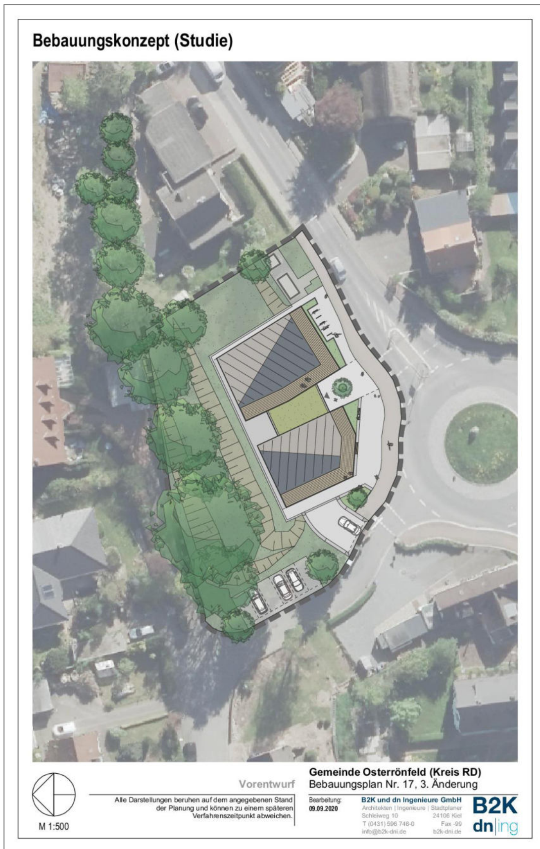
Abbildung 3: Vorentwurf des Bebauungskonzeptes zum B-Plan Nr. 17.3 der Gemeinde Osterröndfeld (Stand: 09.09.2020).