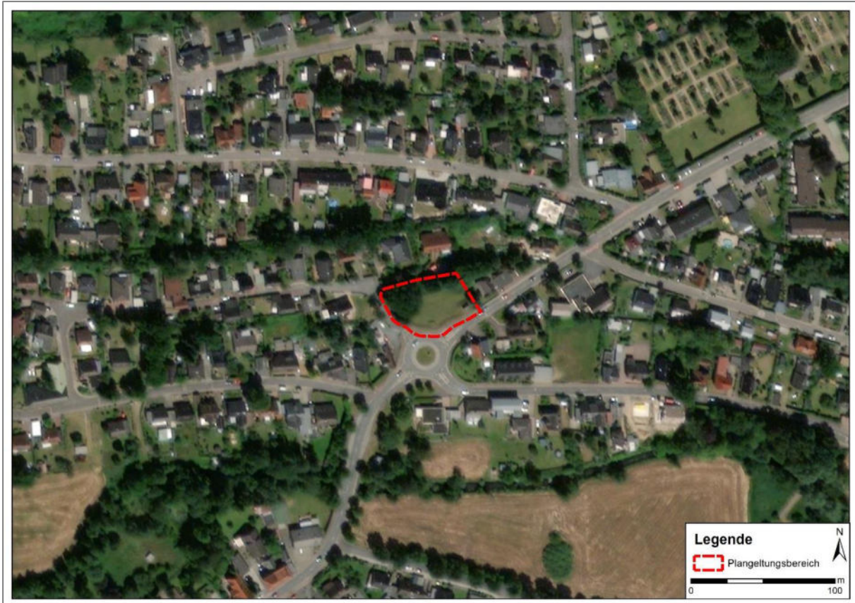
Abbildung 2: Übersicht über das Plangebiet. M = 2.000 (Kartenhintergrund: Esri, DigitalGlobe, GeoEye, i-cubed, USDA FSA, USGS, AEX, Getmapping, Aerogrid, IGN, IGP, swisstopo und die GIS-Anwender-Community).