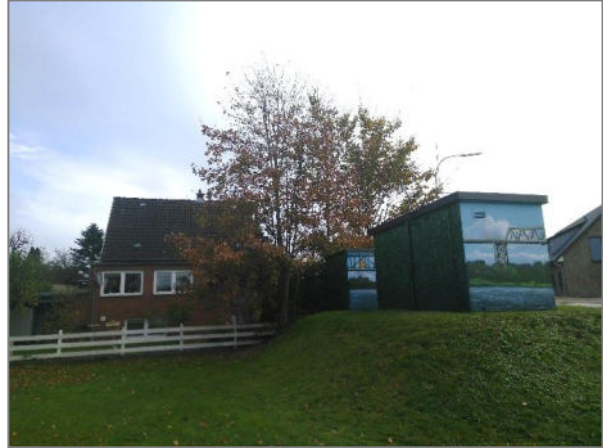
Foto 4: Blick auf die östliche Plangebietsgrenze und die bestehenden Nachbarbebauung ‚Kieler Straße 49‘ sowie die Trafostation der Schleswig-Holstein Netz AG (05.11.2020).