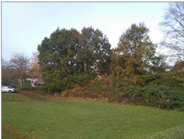
Foto 1: Blick auf die straßenbegleitende Grünfläche ohne Bebauung mit nördlich anschließendem Geländehang mit Gehölzbestand, Blickrichtung Nordwest (05.11.2020).