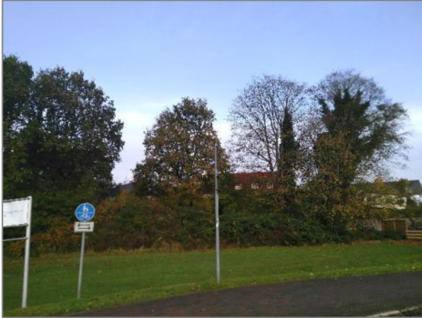
Foto 3: Blick von der Dorfstraße auf die straßenbegleitende Grünfläche ohne Bebauung mit nördlich anschließendem Geländeberg mit Gehölzbestand, Blickrichtung Nord (05.11.2020).