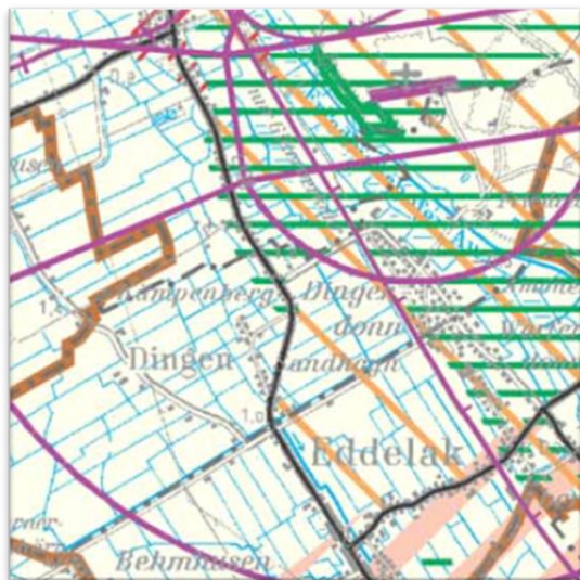
Abbildung 2: Ausschnitt aus dem Regionalplan für den Planungsraum IV (2005)

Südlich der Gemeinde befindet sich ein Stadt- und Umlandbereich im ländlichen Raum zum Unterzentrum Brunsbüttel. Darüber hinaus befindet sich im Westen ein Leitungsnetz (Bestand) und im Osten eine zwei- oder mehrgleisige Bahnstrecke.