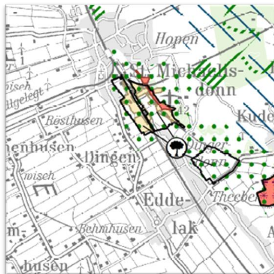
Abbildung 4: Ausschnitt aus dem Landschaftsrahmenplan für den Planungsraum III - Hauptkarte 1 (2020)

Nach Hauptkarte 1 des Landschaftsrahmenplanes für den Planungsraum III aus dem Jahr 2020 liegen nördlich und östlich der Ortslage Dingen Gebiete mit besonderer Eignung zum Aufbau eines Schutzgebiets- und Biotopverbundsystems. Dort befinden sich zusätzlich ein Naturschutzgebiet sowie ein gesetzlich geschütztes Biotop gemäß § 30 BNatSchG i.V.m. § 21 LNatSchG größer 20 Hektar.