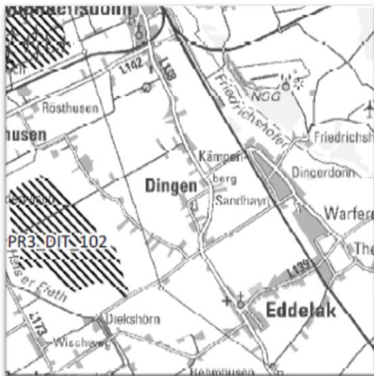
Abbildung 3: Ausschnitt aus dem Regionalplan III-West (Windenergie an Land) (2020)

Der Regionalplan für den Planungsraum III – West (Windenergie an Land) von 2020 sieht in näherer Umgebung zur Gemeinde Dingen ein Vorranggebiet für Windenergienutzung vor. Dieses liegt ca. 1,5 km vom Siedlungsbereich entfernt.