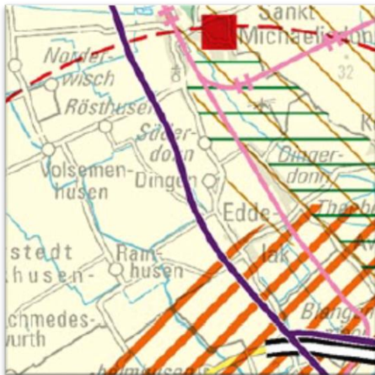
Abbildung 1: Ausschnitt aus dem Landesentwicklungsplan (2021)

Die Gemeinde Dingen liegt gemäß Landesentwicklungsplan von Schleswig-Holstein (LEP 2021) im ländlichen Raum in einem 10 km Umkreis um das Mittelzentrum Brunsbüttel.