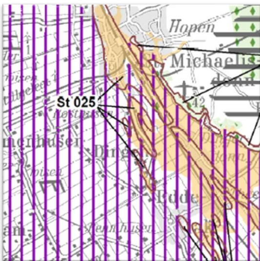
Abbildung 6: Ausschnitt aus dem Landschaftsrahmenplan für den Planungsraum III - Hauptkarte 3

Gemäß Hauptkarte 2 des Landschaftsrahmenplans für den Planungsraum III grenzt östlich ein großräumiges Gebiet mit besonderer Erholungseignung an. Das Gemeindegebiet und damit das Plangebiet liegt in einer historischen Kulturlandschaft in einem Beet- und Grüppengebiet.