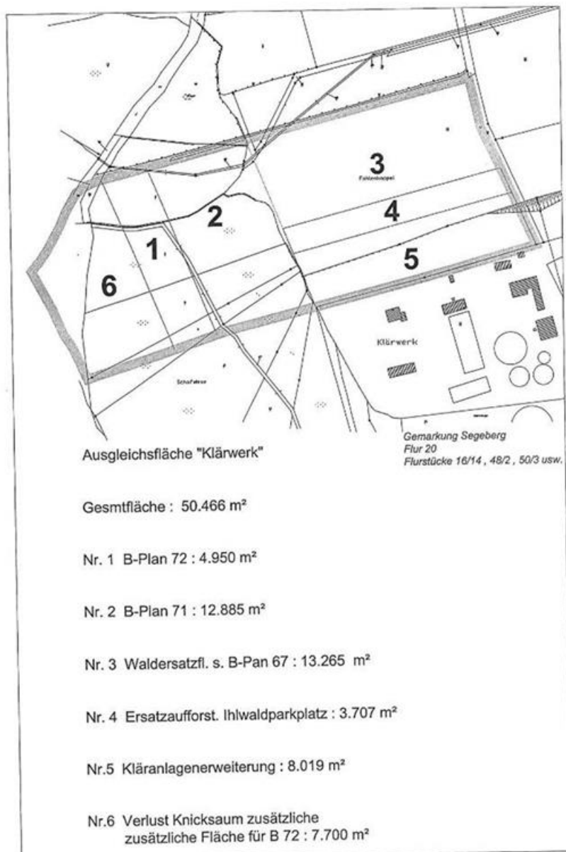
Abb. 3: Übersicht Ökokonto am Klärwerk