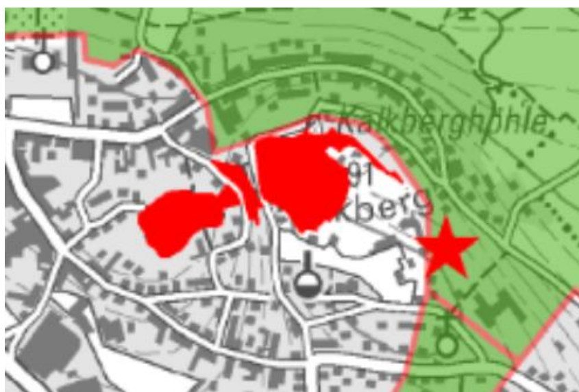
Abb. 2: Ausschnitt Flugkorridore und Funktionsräume (Plan 3, KifL 2022)

Im Konzept zur Erhaltung der Erreichbarkeit der Segeberger Kalkberghöhle aus dem Jahr 2022, welches vom Kieler Institut für Landschaftsökologie (KifL) erstellt wurde, liegt die zu betrachtende Fläche im essenziellen Funktionsraum „Kalkberg bis Großer Segeberger See“, dass als Durchflugs- und Nahrungsraum von den Fledermäusen genutzt wird. Darüber hinaus wird die Fläche als Sammelplatz bei der Abwanderung im Frühling hervorgehoben (vgl. Abb. 2). Im Rahmen stationärer Erfassungen im Jahr 2014 wurden hier besonders starke Aktivitäten festgestellt, die für die herausragende Bedeutung des Gehölzbestandes (Plangebiet) für die Fledermäuse der Kalkberghöhlen sprechen.