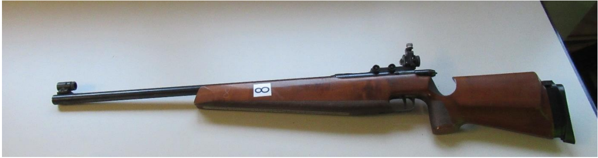
Abbildung 12-1, verwendete Kleinkaliberwaffe