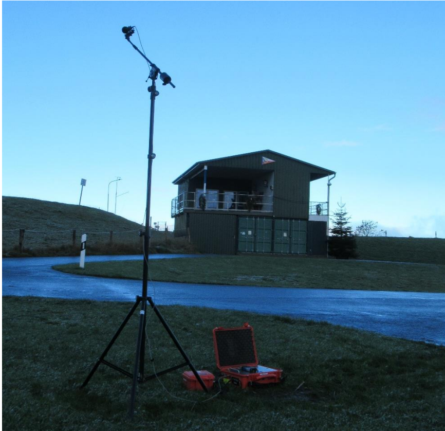
Abbildung 12-3, Aufbau und Positionierung MP 1