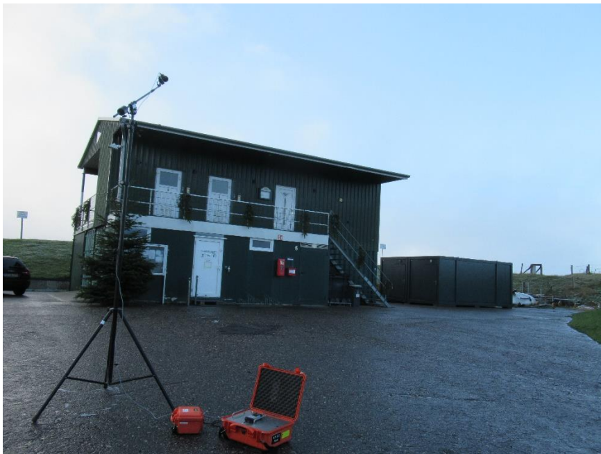
Abbildung 12-4, Aufbau und Positionierung MP 2