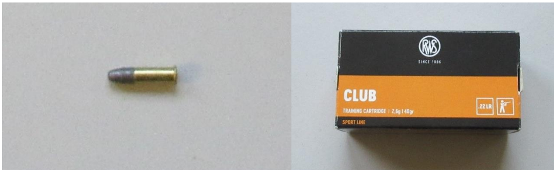
Abbildung 12-2, verwendete Munition (.22 lfB)