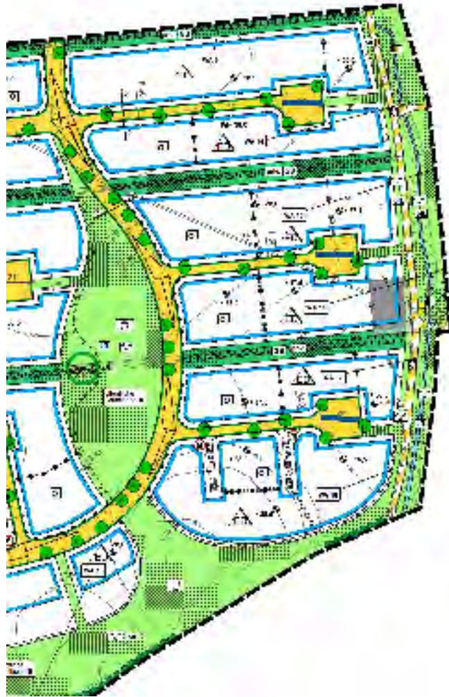
Abbildung 1: Kartenausschnitt