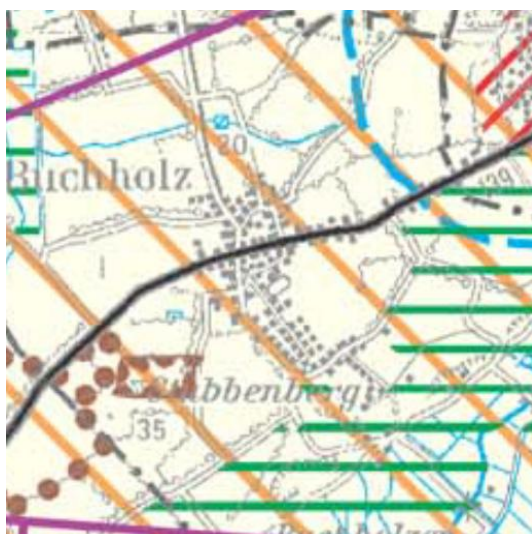
Abb. 3: Regionalplan für den Planungsraum IV

Die Fortschreibung des Landesentwicklungsplans des Landes Schleswig-Holstein (LEP 2020) zeigt im zweiten Entwurf keine abweichenden Darstellungen.