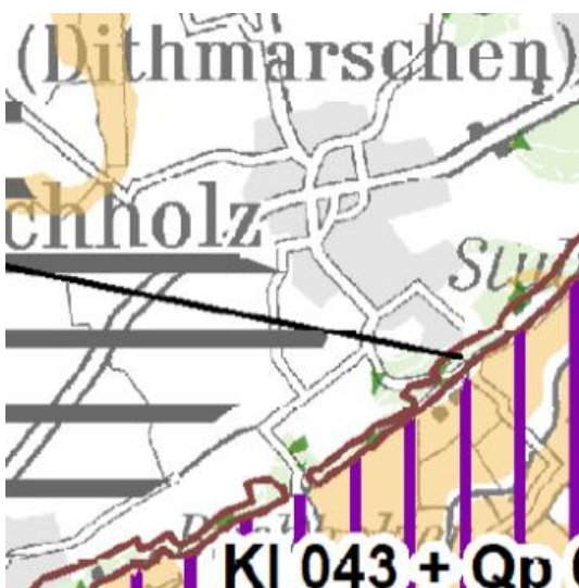
Abb. 6: Hauptkarte 3 des LRP 2020

Gemäß Hauptkarte 2 des Landschaftsrahmenplans sind außerhalb des Siedlungsbereiches historische Kulturlandschaften (Knicklandschaft) vorzufinden. Des Weiteren befindet sich in ca. 580 m Entfernung südlich ein Landschaftsschutzgebiet gemäß § 26 (1) BNatSchG i.V.m § 15 LNatSchG. Ca. 1.000 m südlich befindet sich ein Gebiet, das die Voraussetzungen für eine Unterschutzstellungen nach § 26 (1) BNatSchG i. V. m § 15 LNatSchG als Landschaftsschutzgebiet erfüllt. Gemäß Hauptkarte 2 befindet sich das Plangebiet in einem Gebiet mit besonderer Erholungseignung.