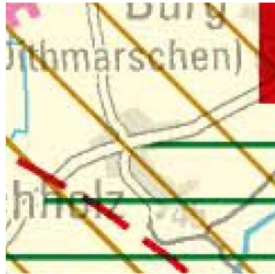
Abb. 2: LEP-Entwurf 2020

Gemäß Landesentwicklungsplan sind die nächsten zentralen Ort Burg (Unterzentrum, 2 km entfernt) und St. Michaelisdonn (ländlicher Zentralort, ca. 7 km entfernt). Westlich grenzt an das Plangebiet der 10 km Umkreis des Mittelzentrums Brunsbüttel.