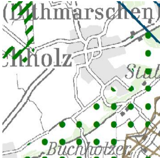
Abb. 4: Hauptkarte 1 des LRP 2020

Der Landschaftsrahmenplan des Planungsraums III (2020) zeigt in Hauptkarte 1 südlich des Plangebietes Waldflächen und ein Gebiet mit besonderer Eignung zum Aufbau des Schutzgebiets- und Biotopverbundsystems, hier als Schwerpunktbereich.