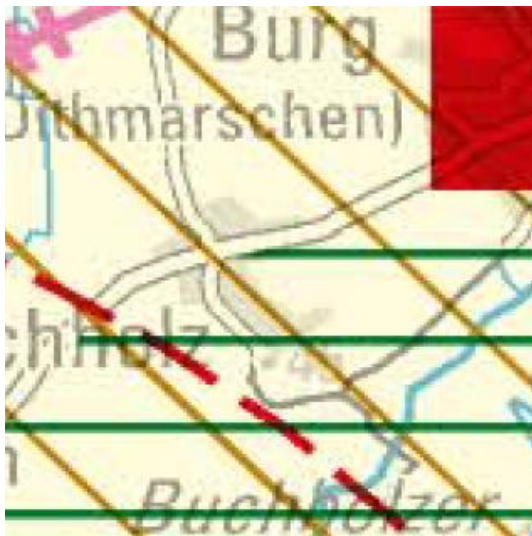
Abb. 1: Landesentwicklungsplan 2010

Die Gemeinde Buchholz (Kreis Dithmarschen) liegt gemäß Landesentwicklungsplan des Landes Schleswig-Holstein (LEP 2010) im ländlichen Raum und ist als Entwicklungsraum für Tourismus und Erholung ausgewiesen. Buchholz hat mit Stand vom 31.12.2019 998 Einwohnerrinnen und Einwohner. Die Gemeinde gehört zum Amt Burg-St. Michaelisdonn. Buchholz hat keine zentralörtliche Funktion.