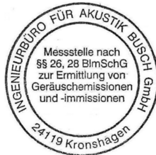
Dipl.-Geophys. Bernd Dörries (Verfasser)