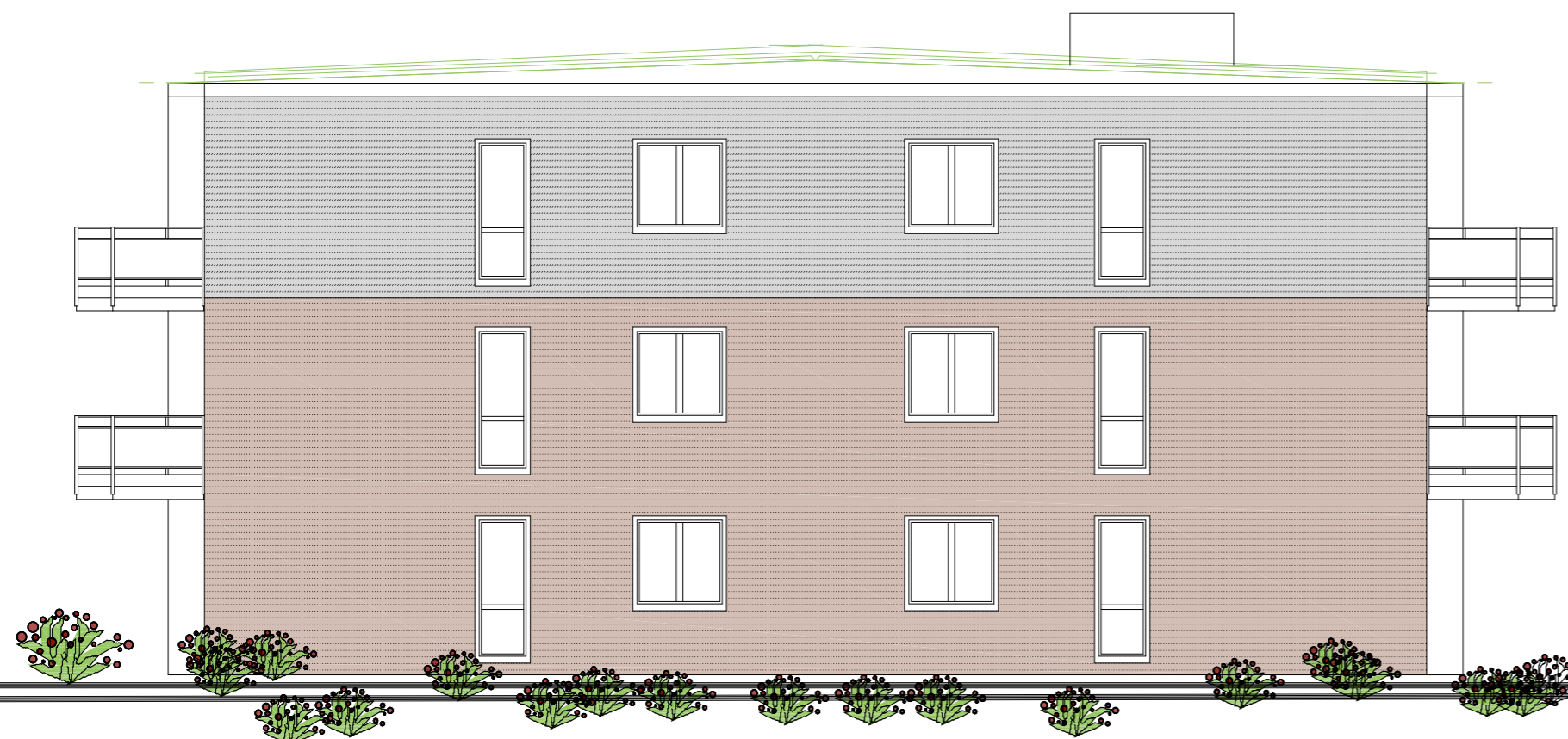
von Süd / Nord