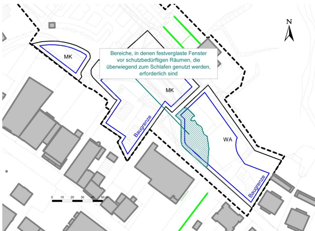
Darstellung der Bereiche zur Anordnung von überwiegend zum Schlafen genutzten Räumen an der lärmabgewandten Gebäudeseite

Sofern dieses nicht möglich ist, sind an den von Überschreitungen betroffenen Gebäudefassaden in Richtung des Discounters bzw. der Straße Zur Mühlau vor schutzbedürftigen Räumen gemäß DIN 4109, nur festverglaste Fenster zulässig.