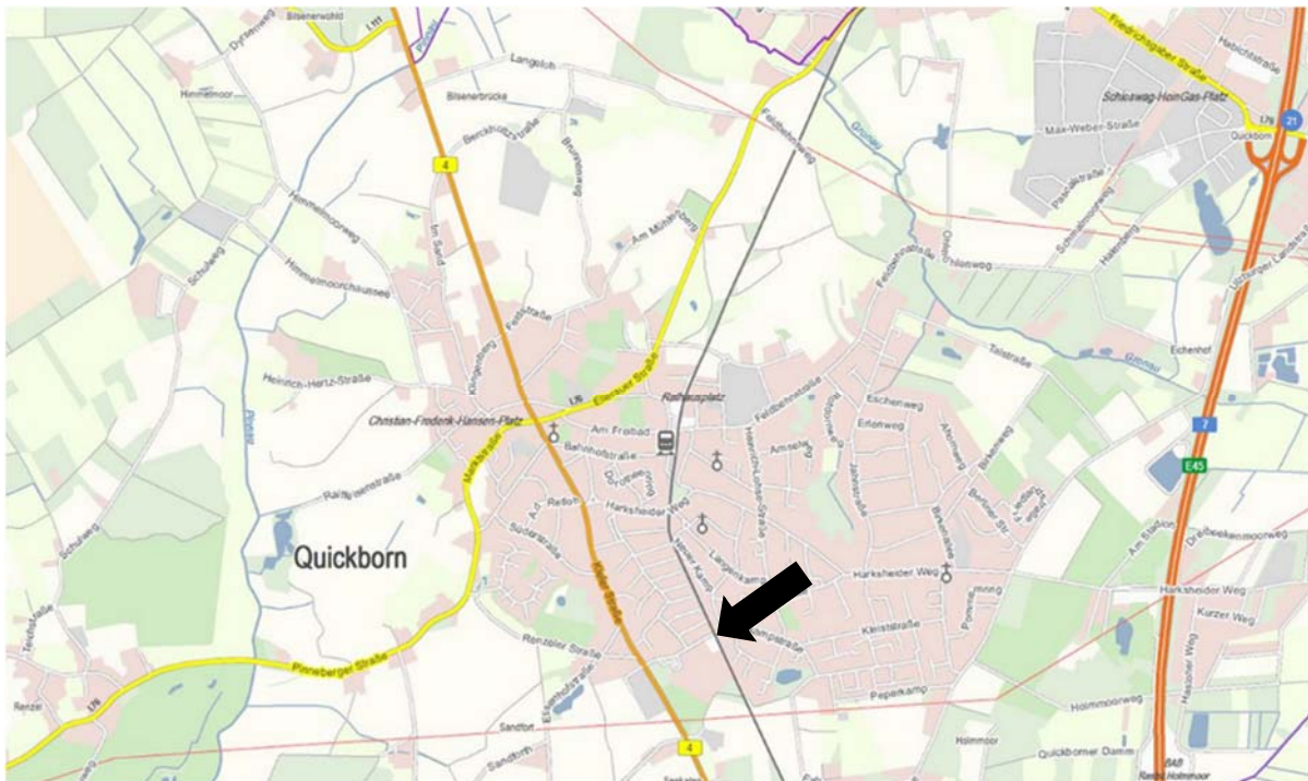
Abb. 1: Lage des Plangebietes im Stadtgebiet, ohne Maßstab,

Die Fläche liegt unmittelbar an der Haltestelle Quickborn-Süd der HVV-Schnellbahnlinie A1 (AKN) und wird im Bestand als P+R-Parkplatz genutzt. Aufgrund der Lage an der morgendlichen Hauptlastrichtung nach Hamburg bildet die Fläche einen optimalen Ausgangspunkt zur Nutzung für Park+Ride. Es befinden sich dort im Bestand knapp 70 Pkw-Stellplätze sowie 160 Fahrradstellplätze, teilweise in Fahrradboxen, die aufgrund ihres Alters in einem schlechten Zustand sind.