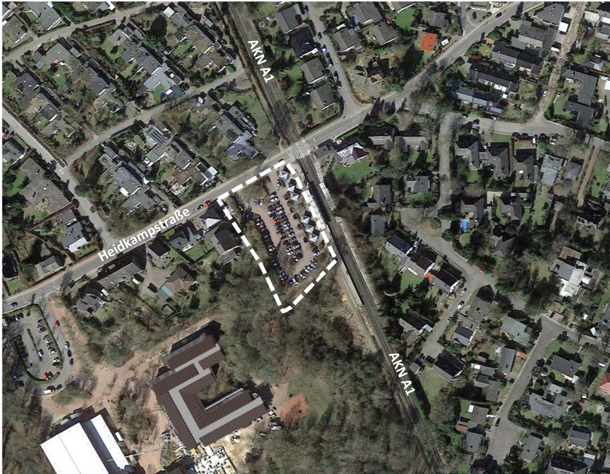
Abb. 2: Luftbild mit Kennzeichnung des Geltungsbereichs des Bebauungsplans Nr. 112, ohne Maßstab, Quelle: Google Earth, © 2009 GeoBasis-DE/BKG