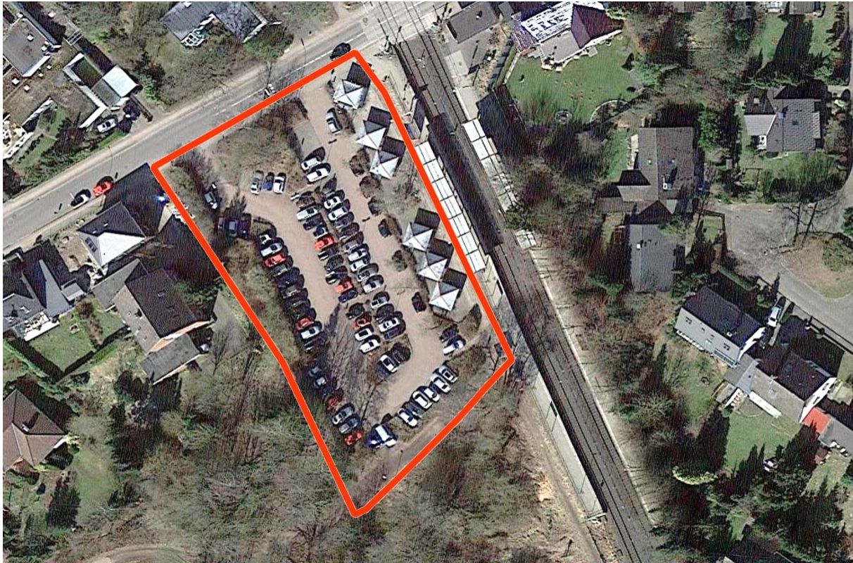
Abb. 5: Luftbild des Plangebiets mit rot eingezeichnetem Geltungsbereich, ohne Maßstab