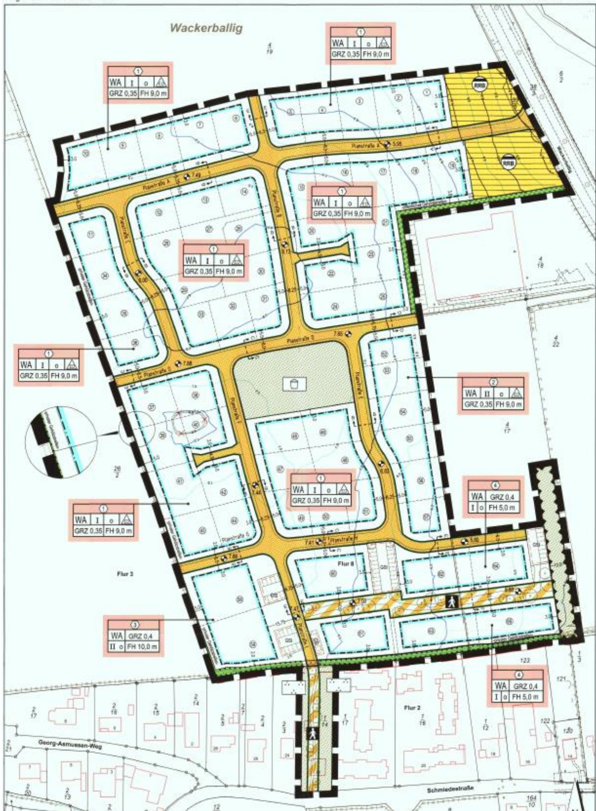
Auszug Planzeichnung Gemeinde Gelting B-Plan Nr. 20 (2017)