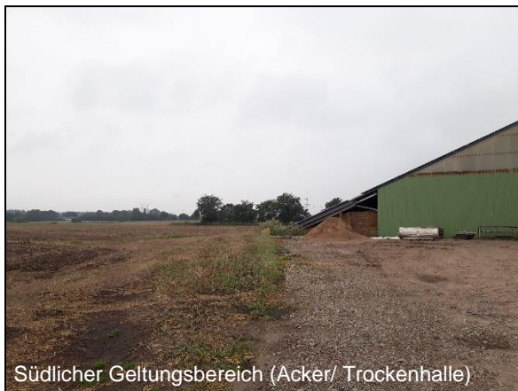
Südlicher Geltungsbereich (Acker/ Trockenhalle)

Die Erweiterungsflächen für die Biogasanlage liegen südlich und westlich der vorhandenen Gebäude/ Rundbehälter und werden für den Getreideanbau landwirtschaftlich genutzt.