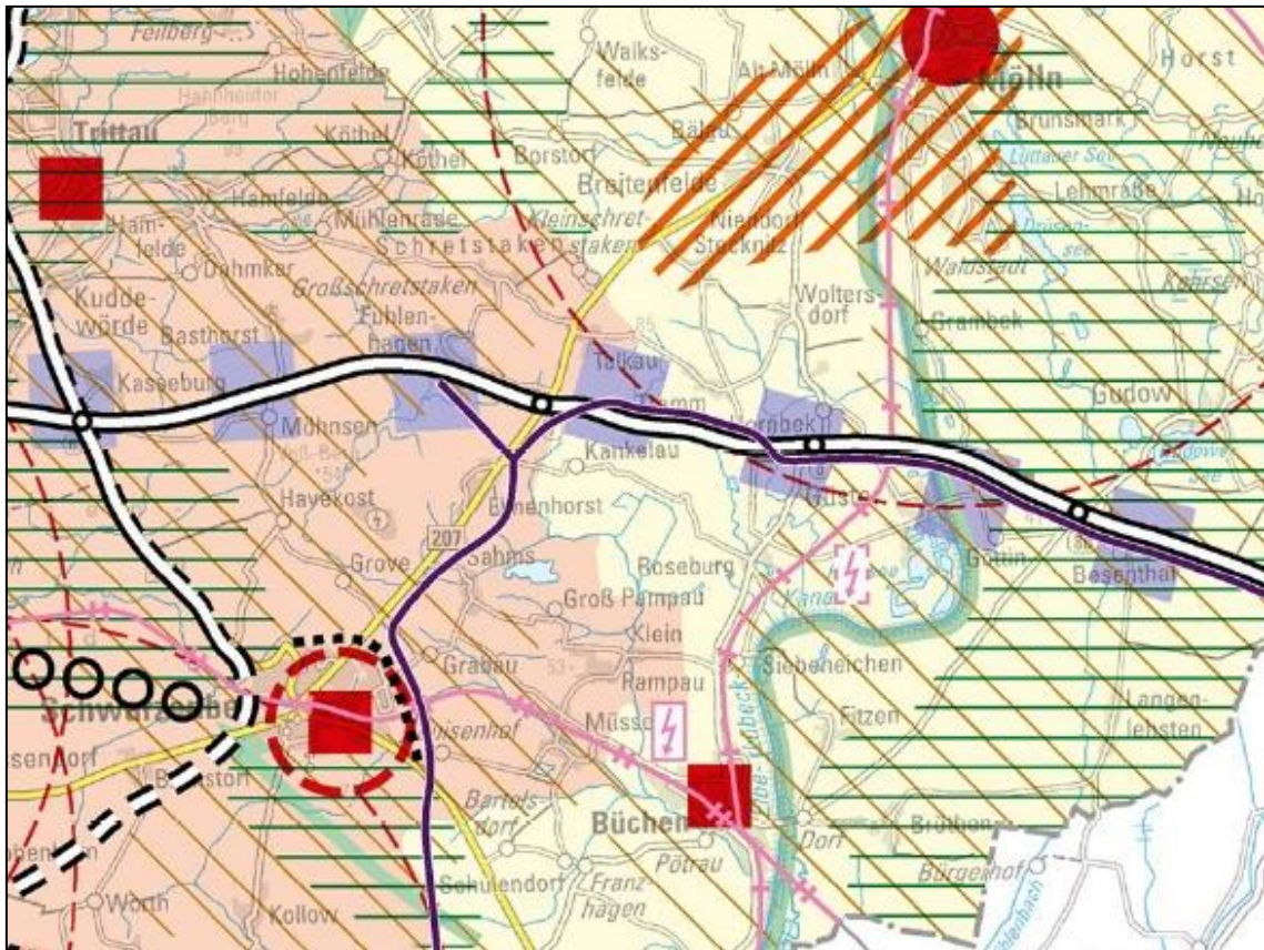
Abb. 1: Auszug aus dem Landesentwicklungsplan Schleswig-Holstein (Fortschreibung 2021)