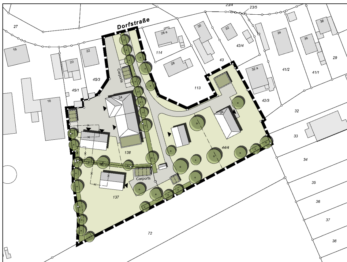
Abb. 3: Bebauungskonzept, PROKOM Stadtplaner und Ingenieure, Stand: 30.09.2022

Allen Konzepten gemeinsam ist zunächst die Anbindung des Plangebietes an die Dorfstraße. In der Konzepterarbeitung wurden unterschiedliche Gebäudetypologien betrachtet. Das Umfeld des Plangebietes ist geprägt durch eine heterogene Bebauung durch großformatige (ehemalige) landwirtschaftliche Betriebe, welche sind vornehmlich entlang der Dorfstraße befinden, sowie kleinteiligen Einfamilienhäusern östlich und innerhalb des Plangebietes.