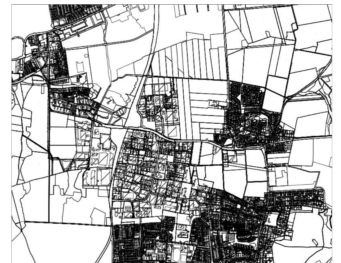
Übersichtsplan M 1 : 25.000

Anbauverbotzone (15m) außerhalb der Ortsdurchfahrten gemäß § 29 Abs. 1 StrVG