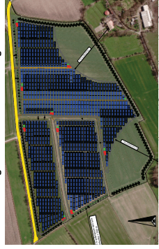
Visualisierung der PV-Freiflächenanlage