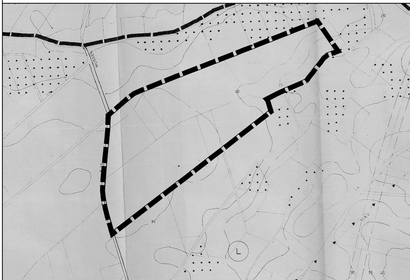
Darstellung derzeit wirksamer Flächennutzungsplan

© GeoBasis-DE/LVermGeo SH (www.LVermGeoSH.schleswig-holstein.de)