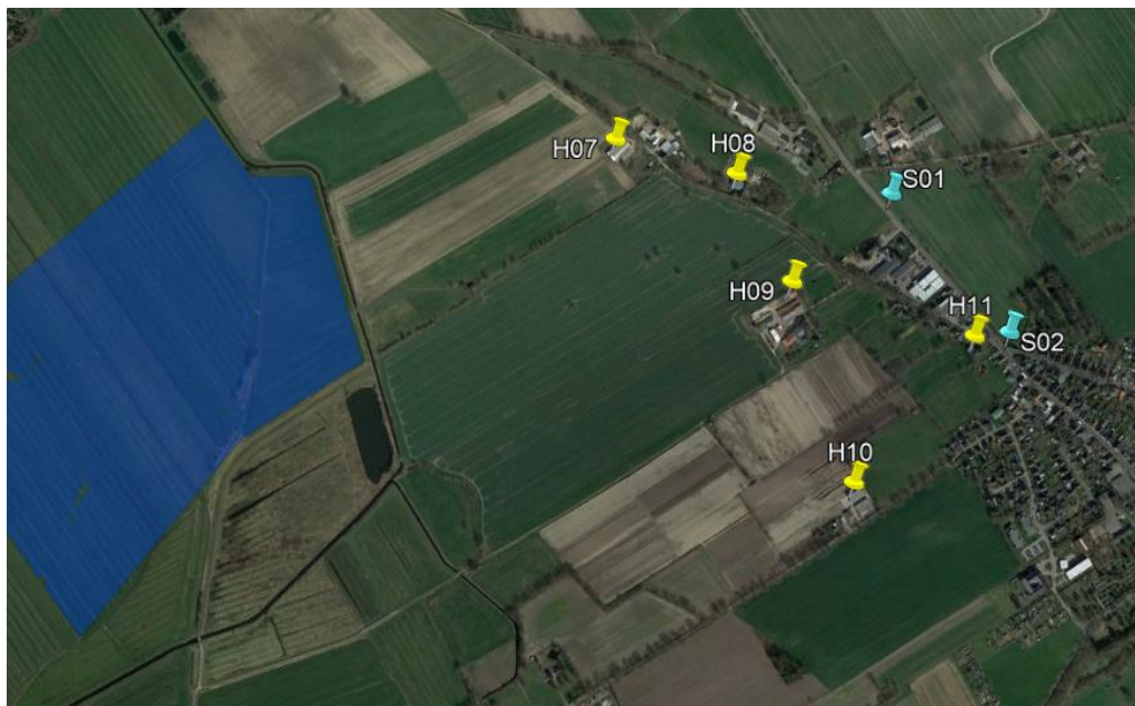
Abbildung 1 PV Feld der geplanten PV- Anlage und betrachtete Immissionspunkte im Osten