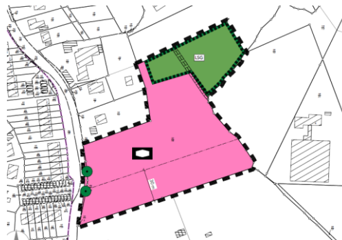
Vorentwurf Planzeichnung B-Plan Nr.77 „Suput-Fläche“

Im Rahmen einer frühzeitigen Öffentlichkeitsbeteiligung können die allgemeinen Ziele und Zwecke der Planung vom 04.11.2024 bis zum 02.12.2024 auf folgenden Plattformen eingesehen werden: