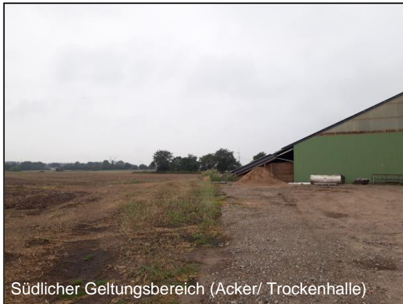
Südlicher Geltungsbereich (Acker/ Trockenhalle)

Die Erweiterungsflächen für die Biogasanlage liegen südlich und westlich der vorhandenen Gebäude/ Rundbehälter und werden für den Getreideanbau landwirtschaftlich genutzt.