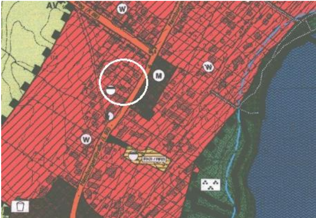
Abbildung 2: Ausschnitt des Flächennutzungsplans (2006)

Südwestlich am Geltungsbereich stellt der F.-Plan Flächen für Ver- und Entsorgungsanlagen -Abwasser- dar. Die Darstellung befindet sich jedoch außerhalb des Geltungsbereiches und im Plangebiet befindet sich keine entsprechenden Anlagen.