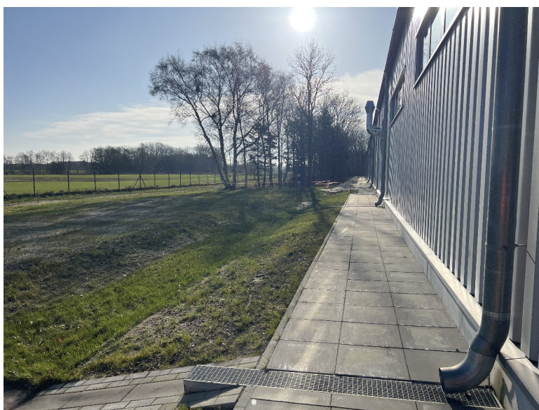
Schaubild 4:

Eine Ausführung der geplanten Variante, einschl. der Abläufe der Rinnen in eine offene Mulde, könnte wie nachfolgend gestaltet werden: