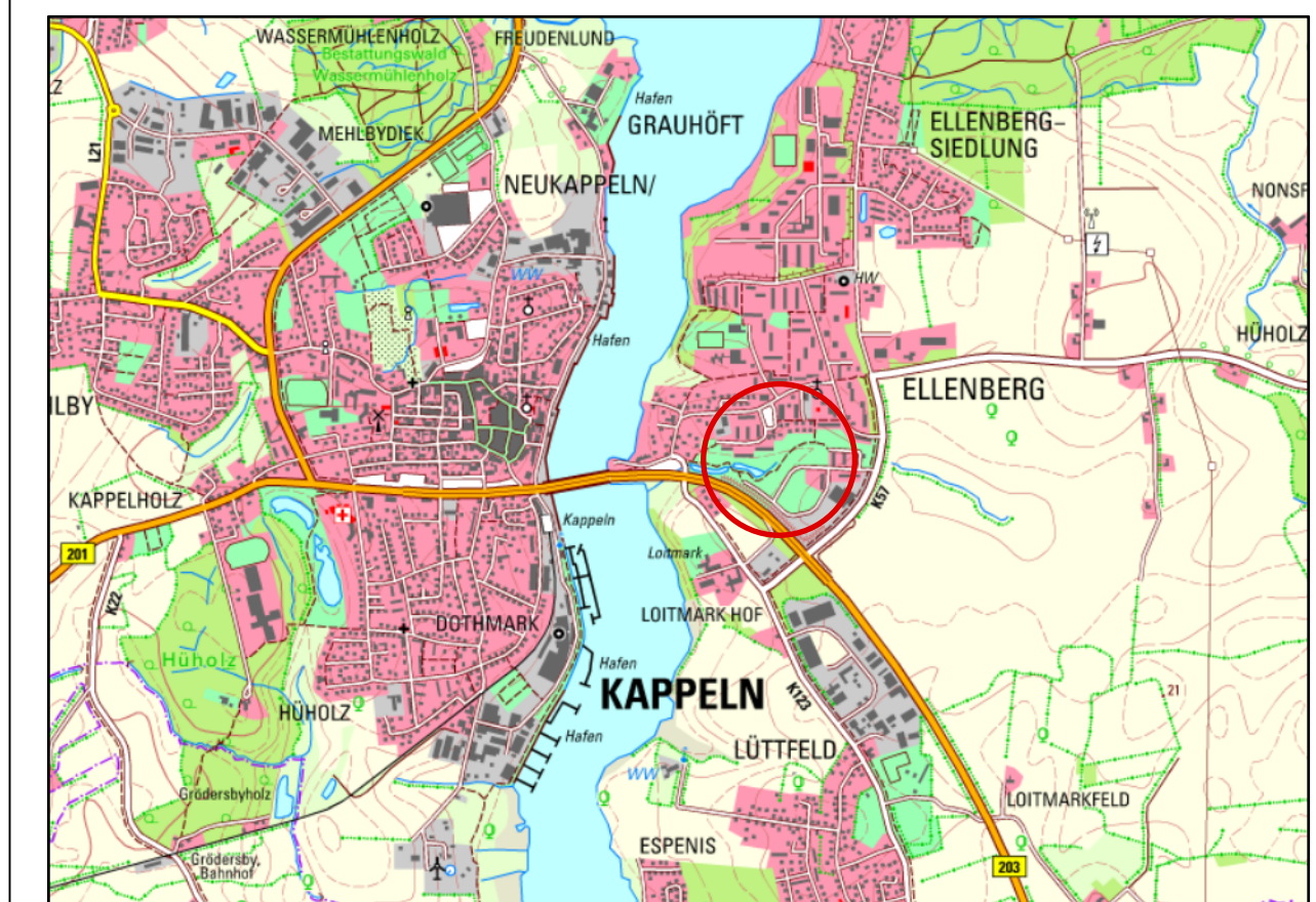
Übersichtsplan M 1:25 000

Aufgrund des § 10 des Baugesetzbuchs (BauGB) in der Fassung vom 3. November 2017 (BGBl. I S. 3634) sowie § 86 LBO in der Fassung vom 6. Dezember 2021 (GVOB. 2021, 1422) wird nach Beschlussfassung durch die Stadtvertretung vom ..... folgende Satzung über den Bebauungsplan Nr. 1 - 11. Änderung "Ellenberg - Wohnbebauung an den Regenrückhaltebecken" für das Gebiet nördlich ..... und westlich ..... bestehend aus den Flurstücken ....., (teilweise) und ..... (teilweise), bestehend aus der Planzeichnung (Teil A) und dem Text (Teil B), erlassen: