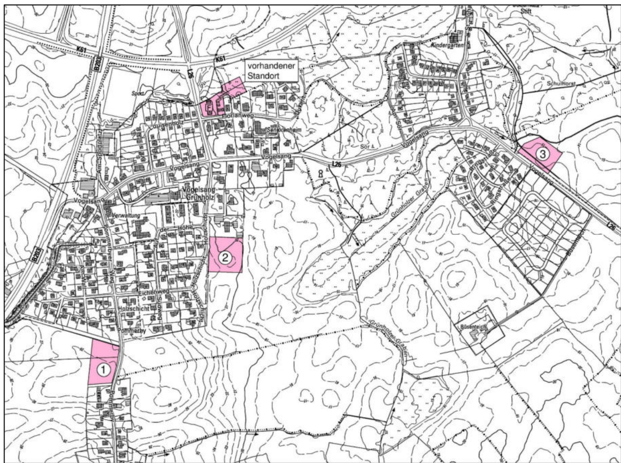
Abbildung der geprüften Standortalternativen

Der dritte geprüfte Standort befindet sich an der Landesstraße L 26 gegenüber dem neuen Baugebiet 'Büsensteich' am südöstlichen Ortsausgang. Dieser Standort ist siedlungsstrukturell deutlich schlechter zu beurteilen, da er einen neuen Siedlungsansatz auf der Ostseite der Landesstraße begründen würde. Die Lücke zum bestehenden Siedlungsbereich auf dieser Straßenseite kann aufgrund der vorhandenen Waldflächen hier nicht geschlossen werden. Immissionsschutzrechtlich sind in etwa die gleichen Voraussetzungen gegeben, wie an den anderen Standorten.