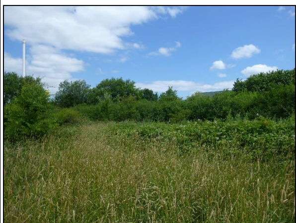
Bild 2: Randlicher Gehölzmantel, davor dichtes Brombeergebüsch mit hohem Gras