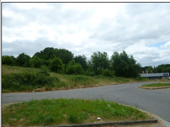
Bild 4: Der Erdbeerberg steigt von Westen nach Osten und von Süden nach Norden an, Blick von Westen her