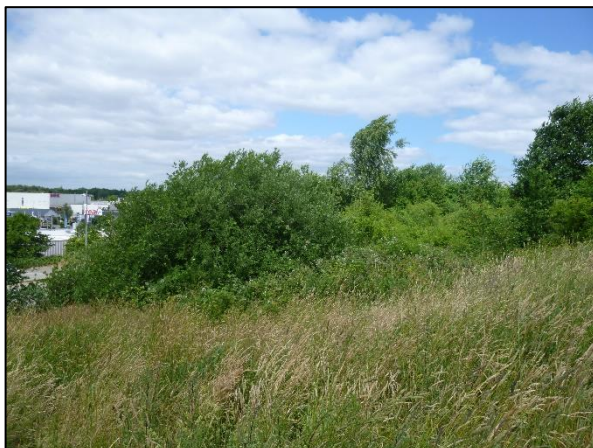
Bild 3: Gras- und Staudenflur, im Bildhintergrund der Gehölzmantel am westlichen Hang