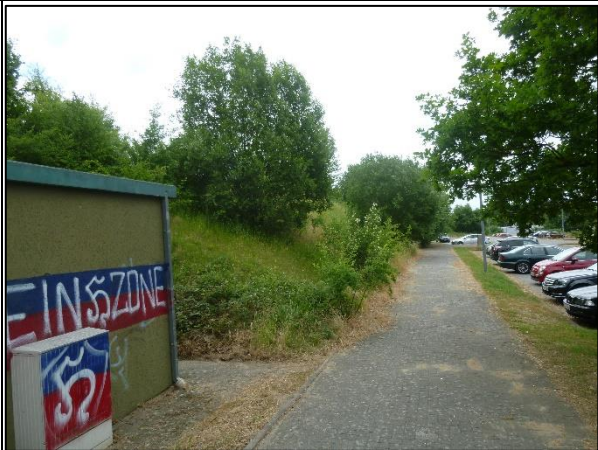
Bild 8: Blick aus der Nordwestecke nach Süden, links im Bild hinter der baulichen Einrichtung der Hang mit Gehölzen