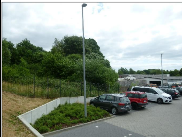
Bild 7: Blick von Westen her auf den von Gehölzen bestandenen Hang.