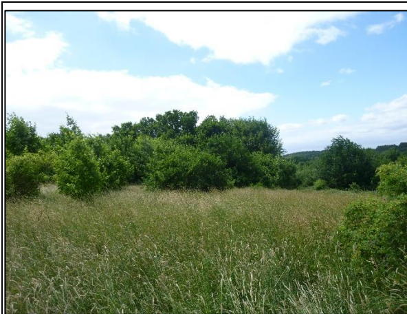
Bild 1: Brache mit trockenen Gras- und Staudenfluren, locker von Gehölzen bestanden

Der Erdbeerberg ist durch die umgebende geschlossene Bebauung (Gebäude, Stellplatzflächen, Straßen) praktisch isoliert von anderen naturnahen Landschaftselementen. Von den weiter entfernten gehölzdomierten Bereichen, Waldarealen und naturnahen Gewässern (z.B. im Osten und Süden) ist der Erdbeerberg durch die Gutenbergstraße und die Bahntrasse getrennt. Einen Eindruck von der Situation vor Ort vermitteln die Bilder Nr. 1-8.