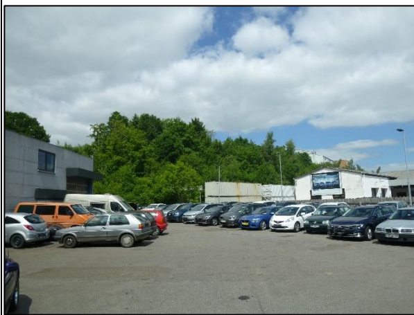
Bild 5: Blick von Südosten her, vom Autohaus an der Gutenbergstraße zum Erdbeerberg