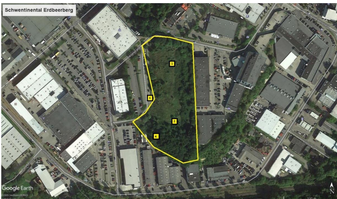
Abbildung 5: Standorte Nr. 1 – 4 der im Juli und August 2018 im B-Plangebiet Nr. 69 „Kerngebiet Ostseepark, Erdbeerberg“ ausgebrachten Horchboxen

In älteren Bäumen im PG sind zwar Höhlen vorhanden, in denen eine potenzielle Eignung für Wochenstubenquartiere baumbewohnender Fledermausarten (z.B. Großer Abendsegler) gegeben sein könnte, allerdings wird eine sommerliche Großquartiernutzung dieser Höhlen durch Fledermäuse auf Grund der festgestellten geringen Individuenzahlen ausgeschlossen. Auch ist es sehr unwahrscheinlich, dass der Große Abendsegler im PG Winterquartiere in geeigneten Höhlen stärkerer Bäume bezieht (in Bäumen ab 50 cm Durchmesser).