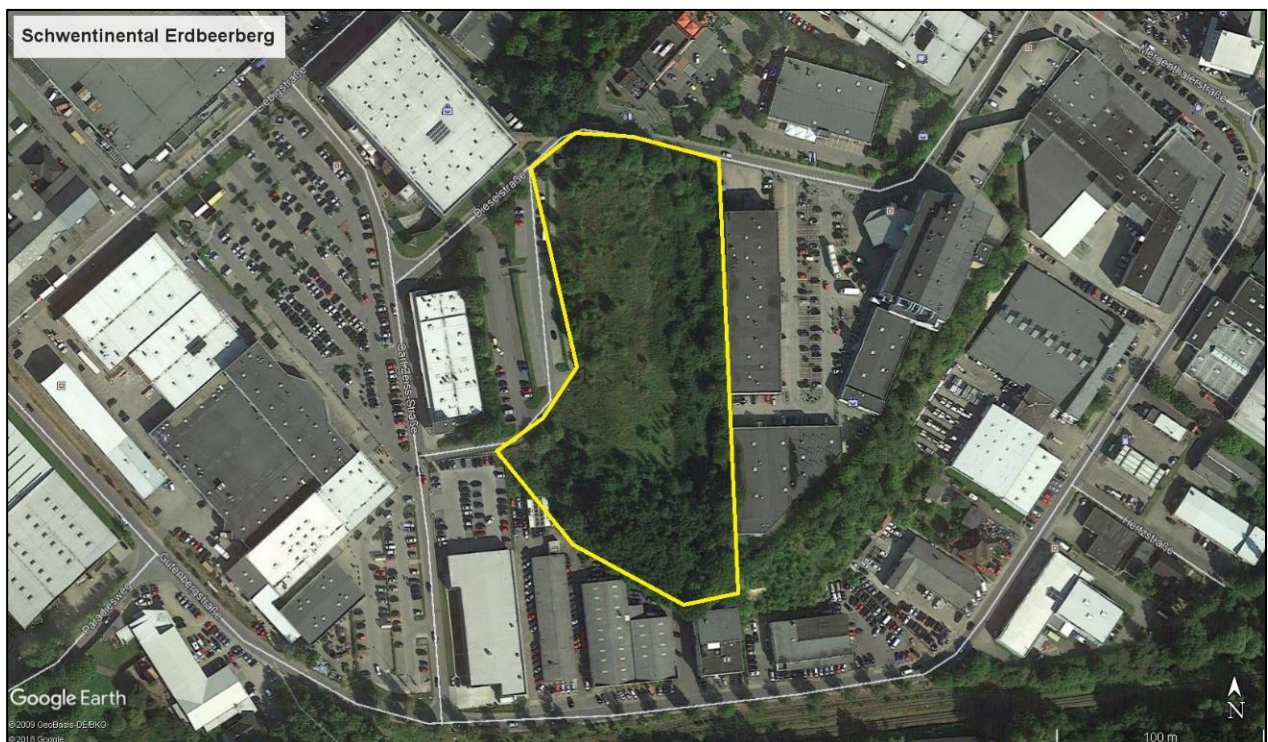
Abbildung 1: Lage des Untersuchungsgebietes Erdbeerberg im Ostseepark Schwentidental

Die Stadt Schwentidental möchte den Kernbereich des Ostseeparks Ortsteil Raisdorf überplanen und stellt den Bebauungsplan Nr. 69 auf. Innerhalb des Bebauungsplangebietes befindet sich eine erhöht liegende, bisher unbebaute Grünfläche, der sogenannte Erdbeerberg . Die Abbildungen Nr. 1 und Nr. 2 zeigen die Lage des Plangebietes (PG) im Stadtgebiet von Schwentidental westlich der Bundesstraße B76. Der Erdbeerberg befindet sich südlich der Dieselstraße, nördlich der Gutenbergstraße und östlich der Carl-Zeiss-Straße und ist ringsherum von vollflächiger Bebauung umgeben. Südlich des Gebietes verläuft die Bahnlinie Preetz-Kiel. Die Freifläche (Flur 2, s. Abb. 5) im Bereich des Erdbeerberges im Kerngebiet des Ostseeparks stellt sich als blüten- und insektenreiche Brachfläche mit trockener Gras- und Staudenflur, einem waldähnlichen Bereich und weiteren Gehölzen und Gebüsch dar.