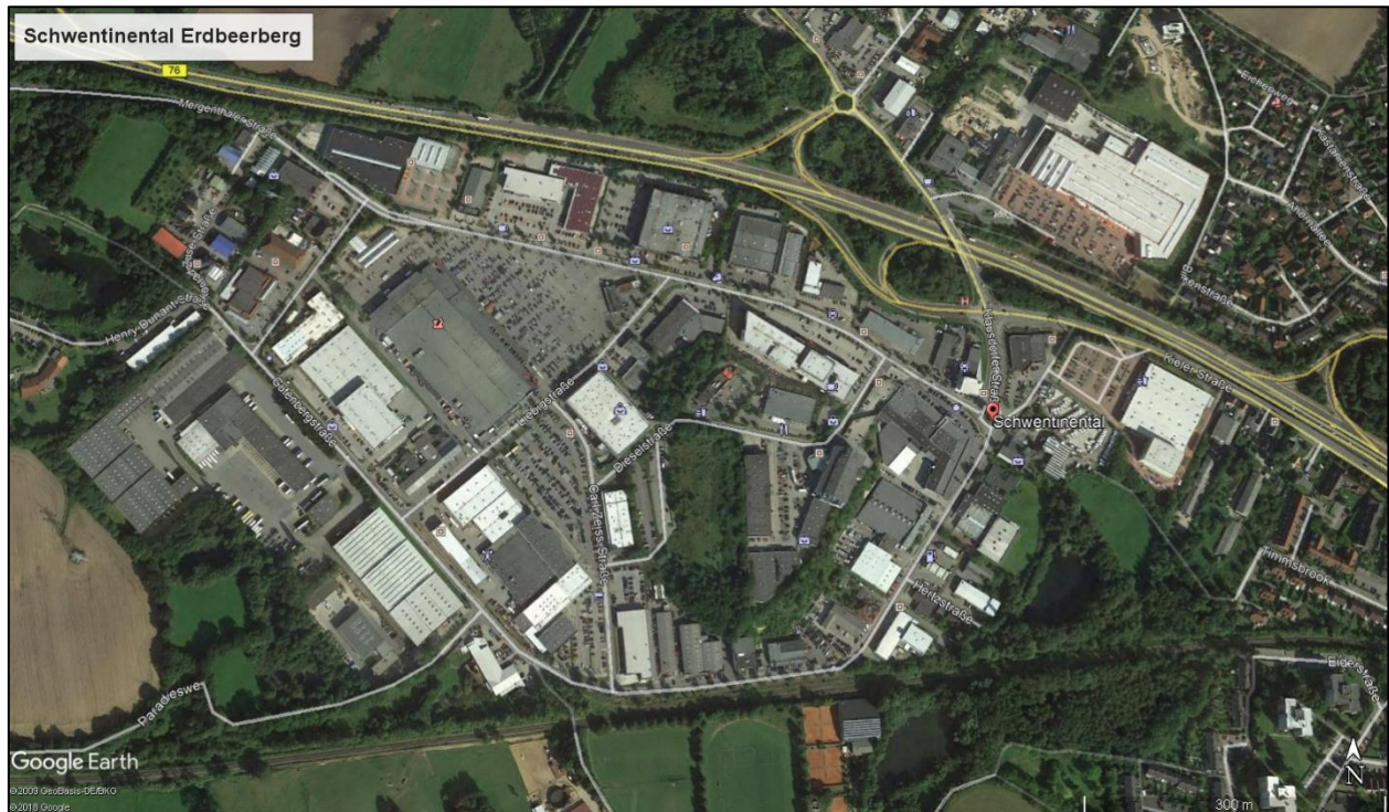
Abbildung 2: Luftbild mit der Lage des Plangebietes im Raum

Als Bestandteil der Planungsunterlagen ist die Erstellung eines Artenschutzberichtes notwendig, der hiermit vorgelegt wird. Darin erfolgt die Bearbeitung der Artenschutzbelange des BNatSchG auf der Grundlage einer „vertiefenden“ Potenzialabschätzung.