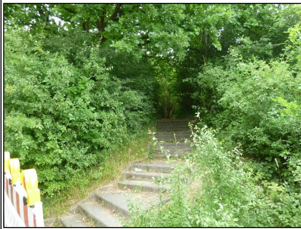
Bild 6: Eine Treppe und ein Fußweg führen durch die Gehölzkulisse im Norden des Erdbeerberges entlang der Dieselstraße