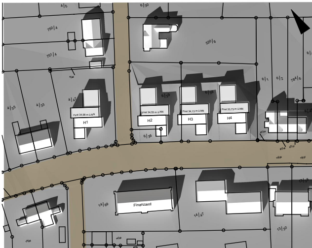
Sonnenstand am 21.6., 15:00 Uhr