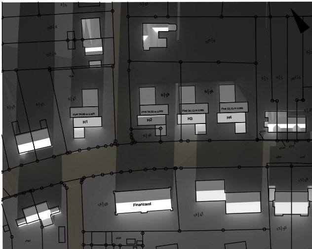
Sonnenstand am 17.01., 15:00 Uhr