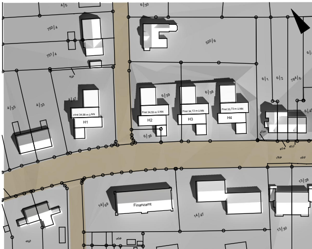
Sonnenstand am 21.06., 12:00 Uhr