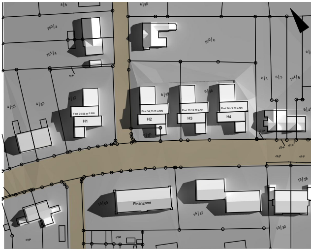
Sonnenstand am 21.06., 9:00 Uhr