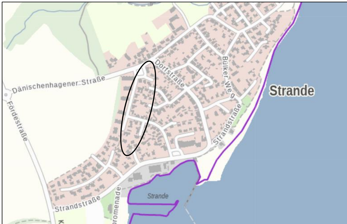
Lage des Plangeltungsbereiches innerhalb des Gemeindegebietes

Der Geltungsbereich der 3. Änderung des Bebauungsplanes Nr. 5 befindet sich am westlichen Rand des Gemeindegebietes und umfasst den östlichen Bereich des Geltungsbereiches des B-Planes Nr. 5 als Ursprungsplanung. Der Bereich der Mehrfamilienhausbebauung innerhalb des festgesetzten reinen Wohngebietes sowie im nördlichen Bereich des allgemeinen Wohngebietes wird nicht mit aufgenommen. Hier bleiben auf Grund der Baustruktur Ferienwohnungen und Betriebe des Beherbergungsgewerbes gemäß den Festsetzungen des Ursprungsplanes ausgeschlossen.