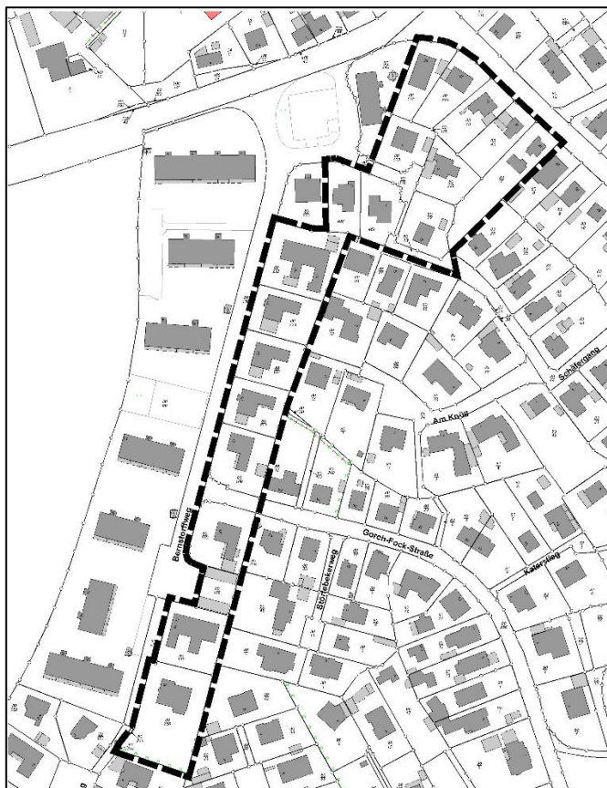
Lageplan des Plangeltungsbereiches der 3. Änderung des Bebauungsplanes Nr. 5