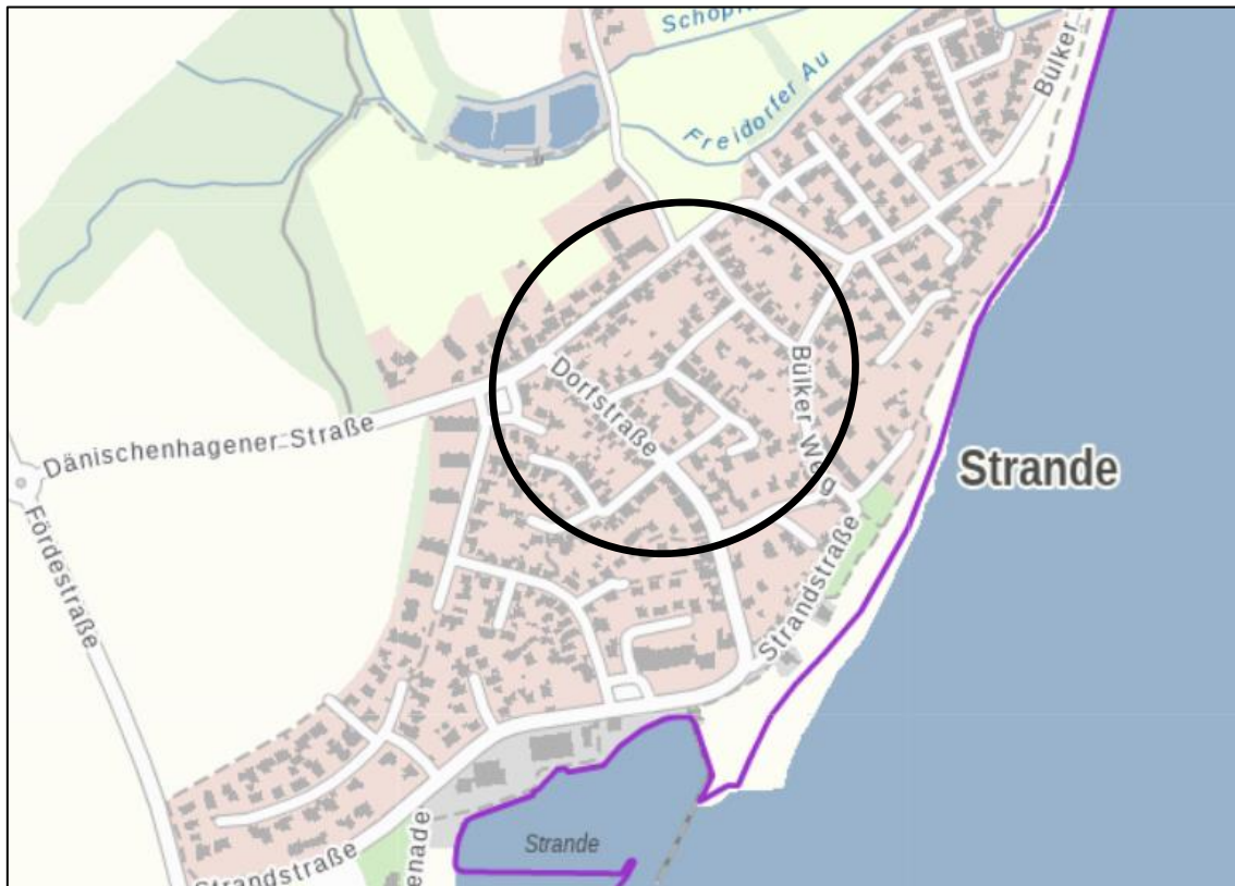
Lage des Plangeltungsbereiches innerhalb des Gemeindegebietes

Der Geltungsbereich der 4. Änderung des Bebauungsplanes Nr. 4 befindet sich im nördlichen Bereich des Gemeindegebietes und umfasst annähernd den gesamten Geltungsbereich des B-Planes Nr. 4 als Ursprungsplanung. Lediglich die Gemeinbedarfsnutzungen am nördlichen Rand sind von der Planänderung ausgenommen.