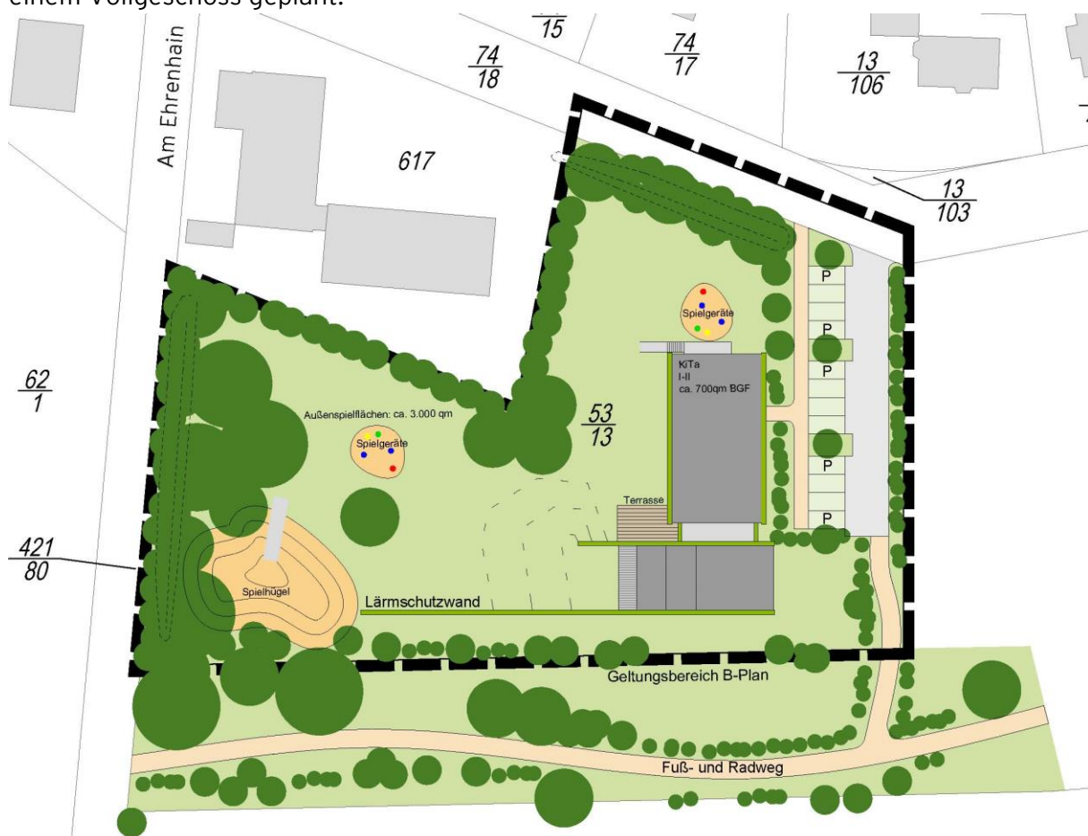
Bebauungskonzept KiTa an der Barsbek (WRS)

Der südliche Gebäudeteil wird mit zwei Vollgeschossen und der nördliche Bereich mit einem Vollgeschoss geplant.