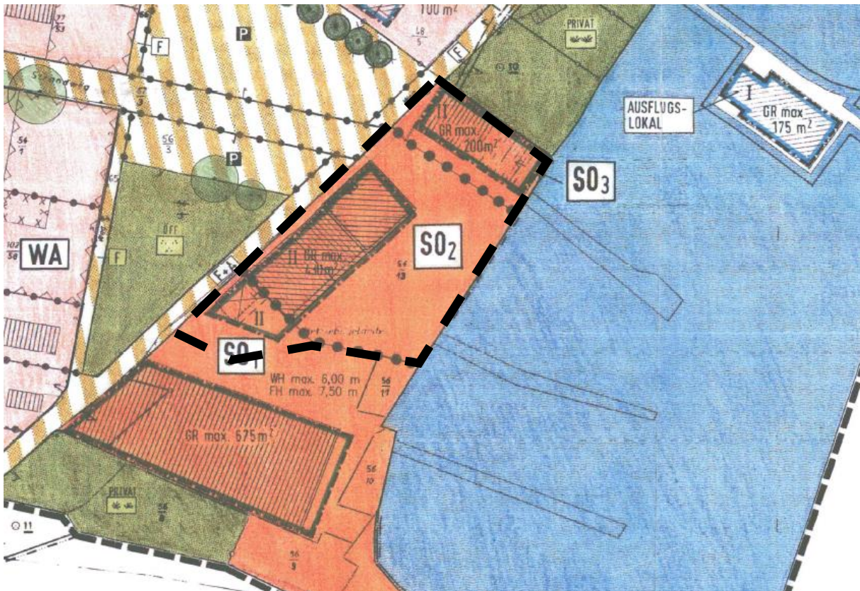
Auszug der Planzeichnung des B-Planes Nr. 1

Der Geltungsbereich der 5. Änderung des Bebauungsplanes Nr. 1 umfasst Teile des Grundstücks Strandweg 124. Von dieser Planänderung betroffen sind das SO2 und SO3 sowie Teile des SO1. Die Größe des Geltungsbereichs beträgt ca. 1.500 m 2 .