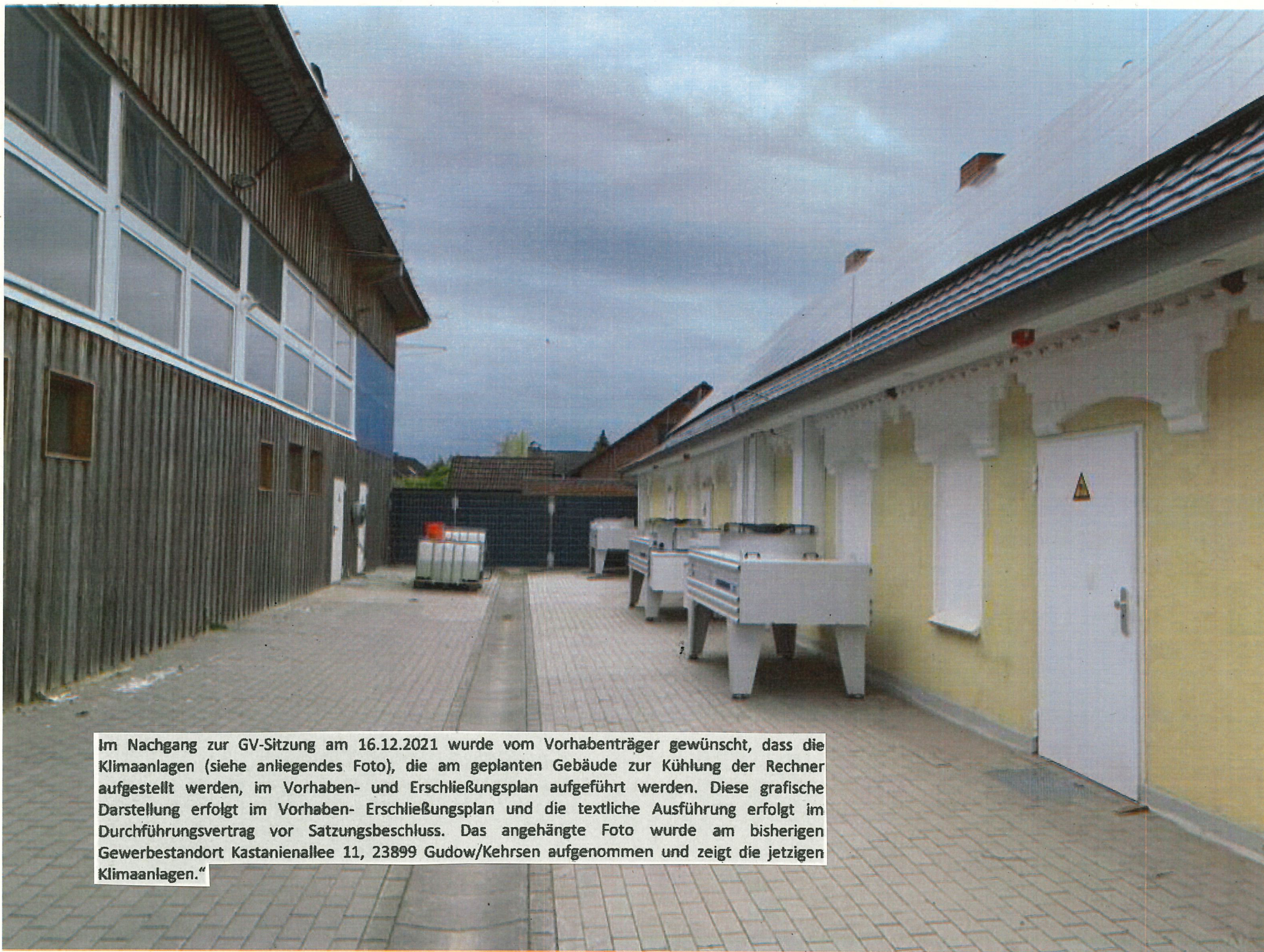
Im Nachgang zur GV-Sitzung am 16.12.2021 wurde vom Vorhabenträger gewünscht, dass die Klimaanlage (siehe anliegendes Foto), die am geplanten Gebäude zur Kühlung der Rechner aufgestellt werden, im Vorhaben- und Erschließungsplan aufgeführt werden. Diese grafische Darstellung erfolgt im Vorhaben- Erschließungsplan und die textliche Ausführung erfolgt im Durchführungsvertrag vor Satzungsbeschluss. Das angehängte Foto wurde am bisherigen Gewerbestandort Kastanienallee 11, 23899 Gudow/Kehrsen aufgenommen und zeigt die jetzigen Klimaanlage.“