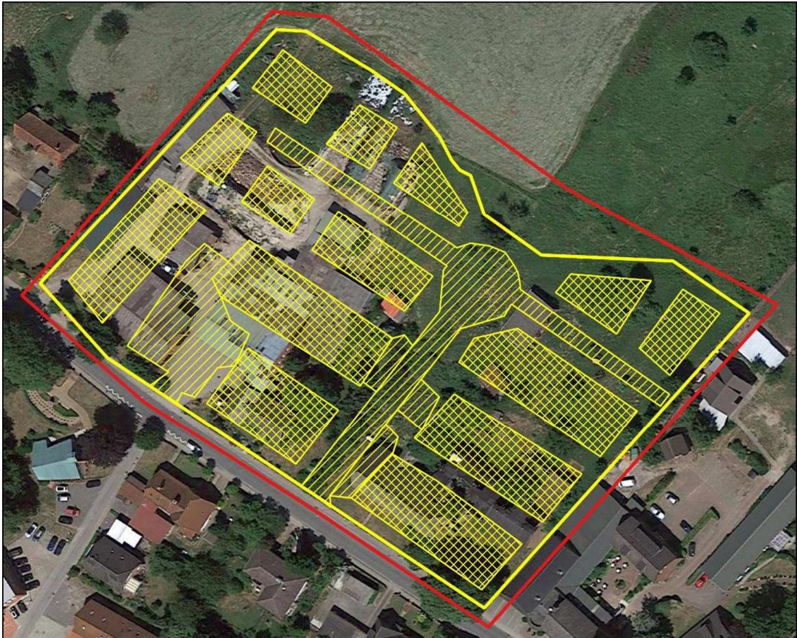
Abbildung 6: Lage des Umrisses der Planung (vgl. Abbildung 5) im Luftbild aus Google-Earth™ (Stand Juni 2018)

Die Wirkungen des Baubetriebes werden im Rahmen des im Hochbau üblichen liegen. Spezielle Arbeiten die besonderen Lärm oder Schadstoffemissionen verursachen, sind nicht vorgesehen und auch wegen der benachbarten Wohnumgebung unzulässig. Die Schadstoffbelastung durch die Emissionen des Baubetriebes wird sich nach dem Stand der Technik im bei modernen Baumaschinen üblichen Rahmen halten und daher keine merklichen Veränderungen an der Vegetation oder der Gesundheit von Tieren im Umfeld der Baustelle hervorrufen.