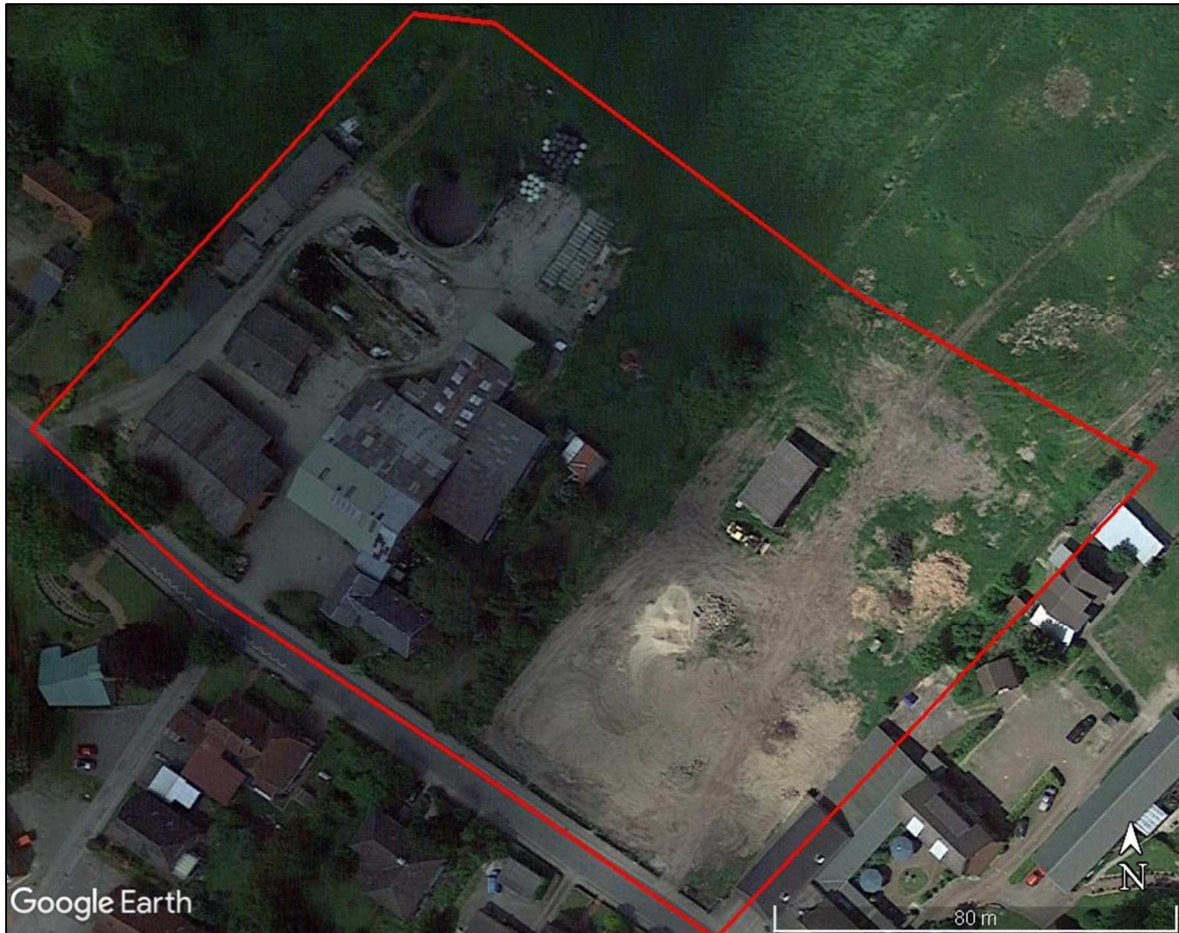
Abbildung 3: Untersuchungsgebiet. (Luftbild aus Google-Earth™, Stand: Juni 2021). Dieses Luftbild wird wegen schlechter Qualität im Folgenden nicht verwendet.

Zunächst ist eine Relevanzprüfung vorzunehmen, d.h. es wird ermittelt, welche Arten des Anhangs IV der FFH-Richtlinie und welche Vogelarten überhaupt vorkommen. Mit Hilfe von Potenzialabschätzungen wird das Vorkommen von Vögeln und Fledermäusen sowie anderen Arten des Anhangs IV der FFH-Richtlinie ermittelt (Kap. 2). Danach wird eine artenschutzfachliche Betrachtung des geplanten Vorhabens durchgeführt (Kap. 4).