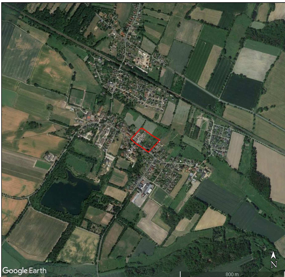
Abbildung 1: Untersuchungsgebiet (rote Linie) und 1 – km – Umfeld