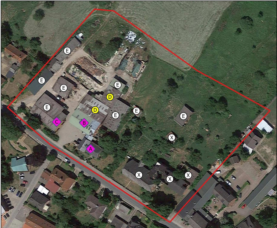
Abbildung 4: Lage der Gebäude der Tabelle 2. Violette Rechtecke sind mit mittlerer Bedeutung für Fledermäuse einzustufen; gelbe Kreise zeigen geringes Potenzial und weiße Kreise haben kein Potenzial für Fledermausquartiere. (Luftbild aus Google-Earth™).