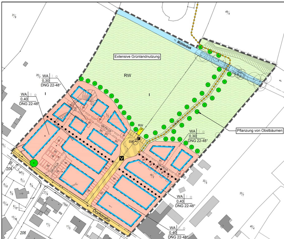
Abbildung 5: Planungs-Entwurf, Zielplan (Stand: 13.10.2021)

Die Planung sieht vor, das Gelände nahezu völlig zu überformen. Die vorhandenen Gebäude werden beseitigt und neue errichtet. Dabei wird die Fläche faktisch durch den Baustellenbetrieb von Vegetation befreit. Ob einzelne Bäume oder Hecken erhalten bleiben, hängt von der konkreten Feinplanung ab, wäre aber quantitativ gering.