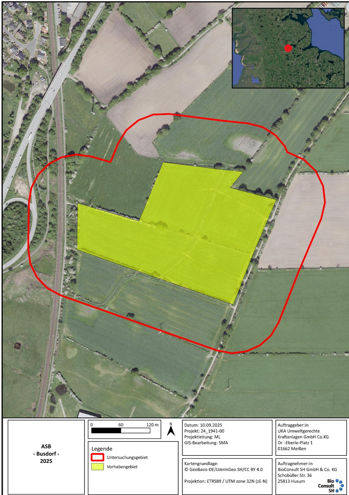
Abb. 1.1: Lage des Vorhabengebietes und des Untersuchungsgebietes (Umkreis von 100 m) für die geplanten Photovoltaik-Anlagen (PVA) mit Batteriespeicher in der Gemeinde Busdorf.