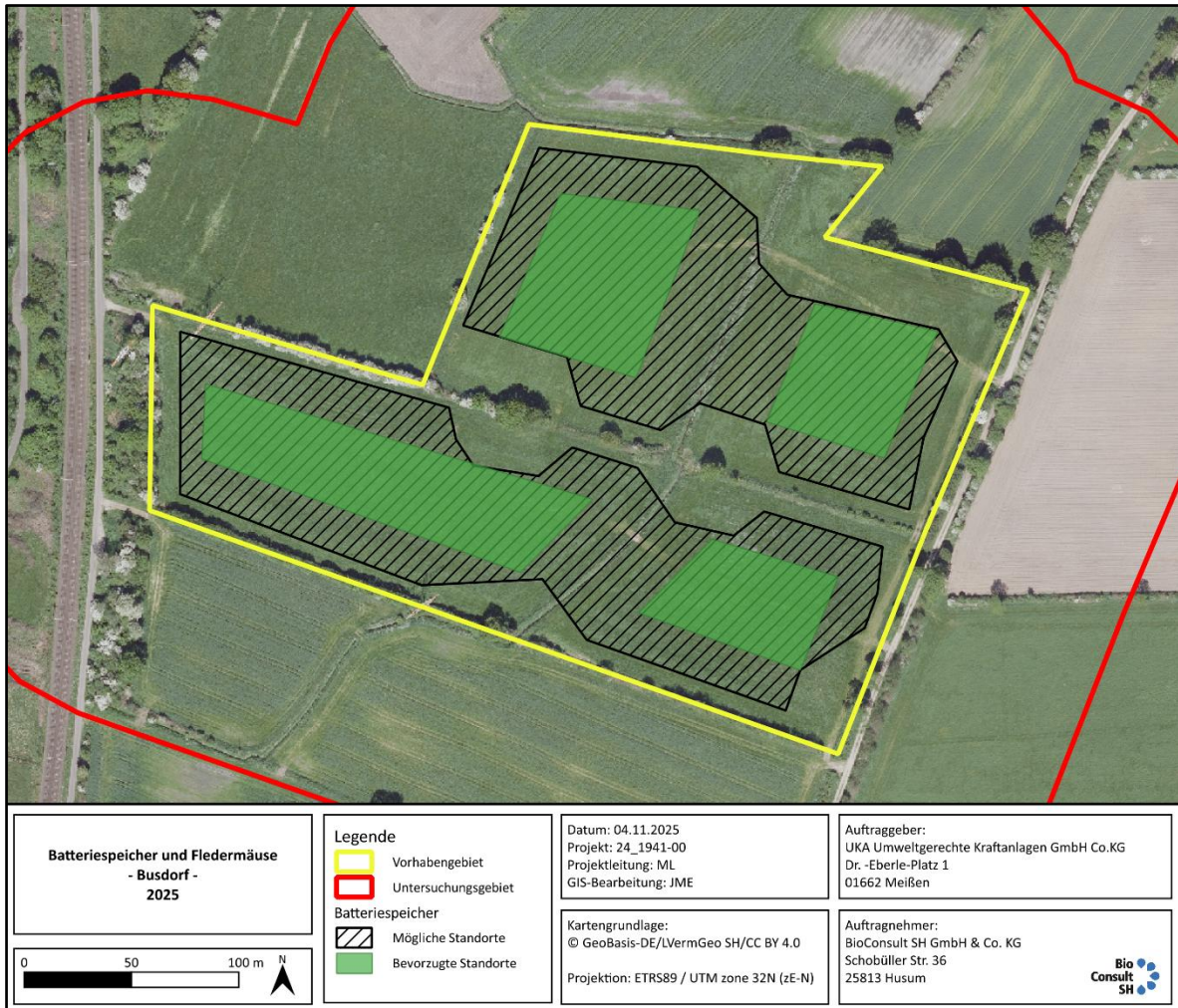
Abb. 5.1 Vorschlag für den Standort des Batteriespeichers (bevorzugte Standorte halten einen Abstand der ultraschallmittlernden Elemente von 30 m zu allen relevanten Strukturen (Gehölze als potenzielle Quartiere und Flugstraßen, Gräben als Nahrungshabitat) ein, die möglichen Standorte berücksichtigen den notwendigen Abstand von 30 m zu potenziellen Quartierbäumen und 10 m zu Gehölzstrukturen).