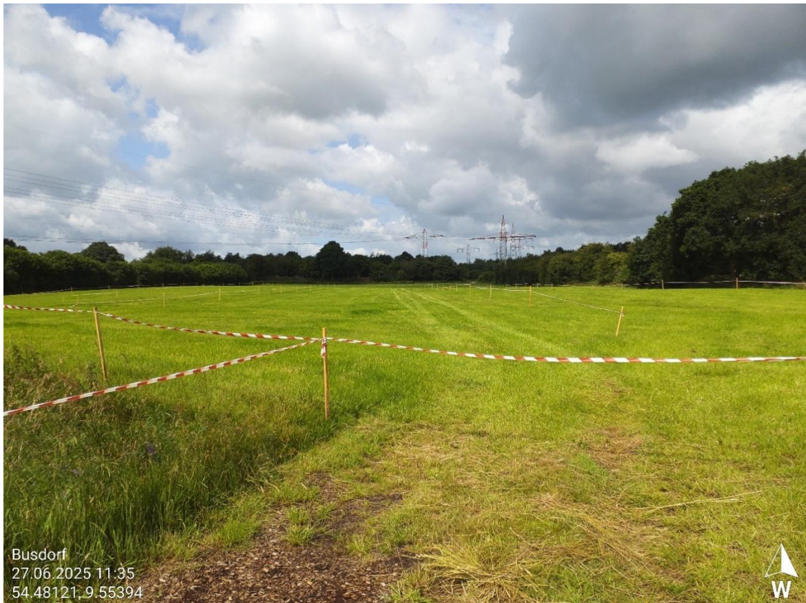
Abb. 2.1 Intensiv bewirtschaftetes Mahdgrünland im Vorhabengebiet für die geplante PVA in der Gemeinde Busdorf.