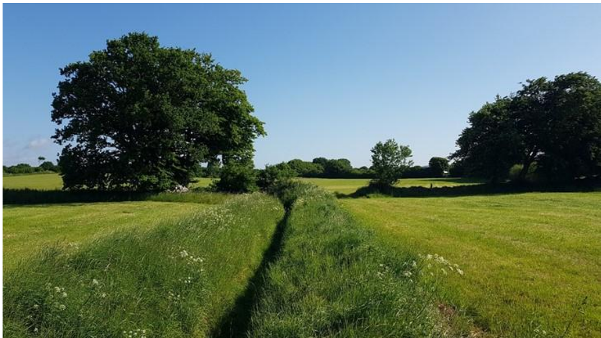
Abb. 2.2 Entwässerungsgraben und lückiger Knick mit Überhältern im Vorhabengebiet (Blickrichtung Norden, Datum: 26.05.2025).