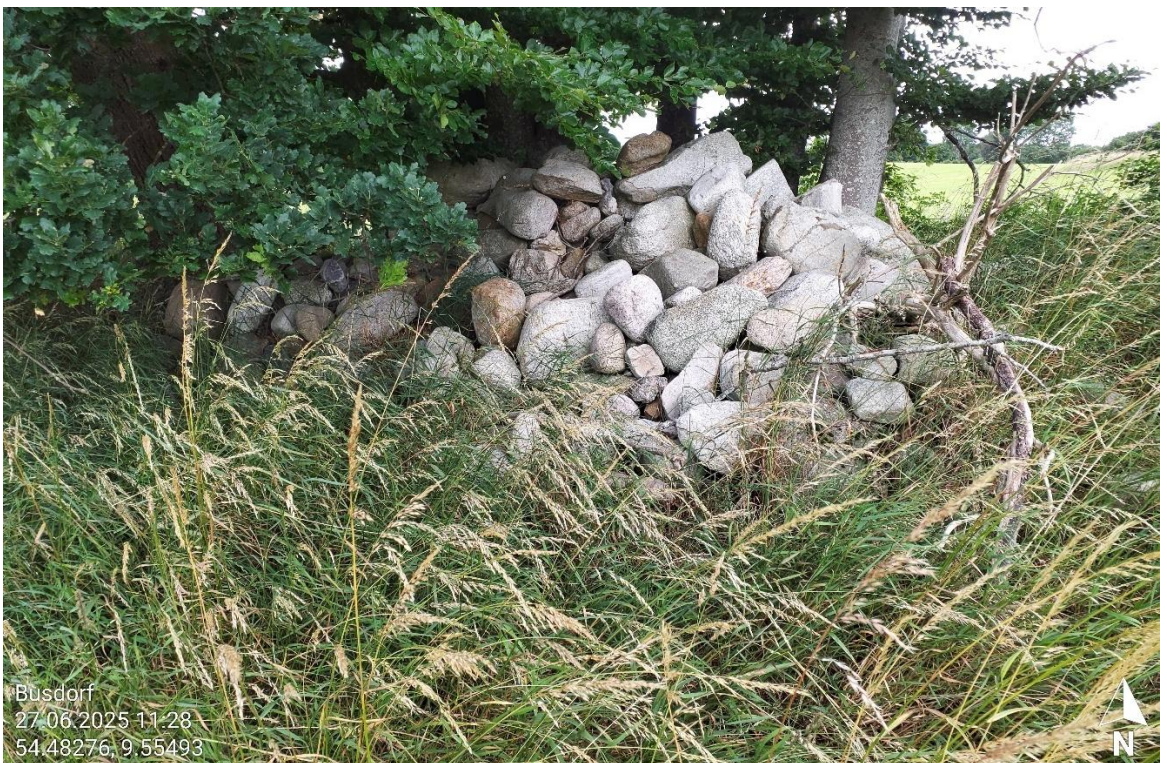
Abb. 2.6 Lesesteinhaufen im Vorhabengebiet.