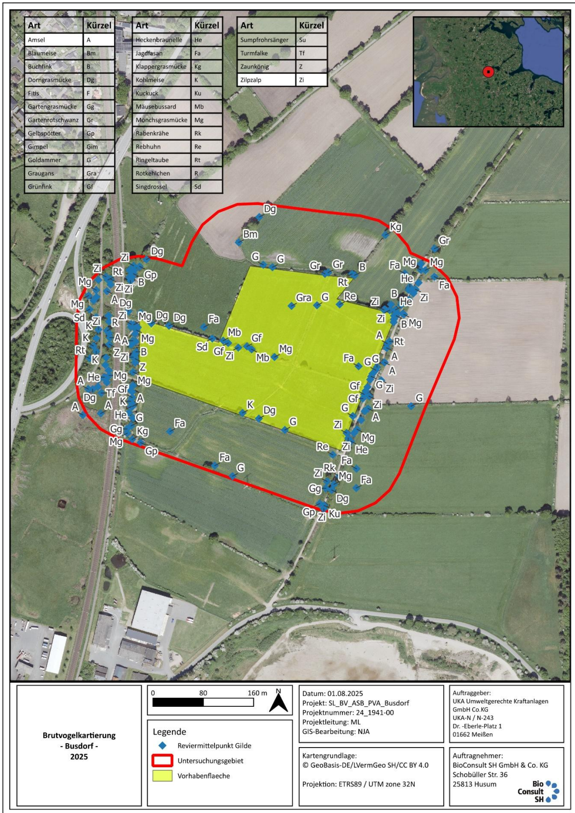
Abb. 3.1 Darstellung der auf Gildenebene zu betrachtenden Brutvogel-Revire im Vorhaben- und Untersuchungsgebiet (100 m Puffer) (in der Tabelle wurden die erste und letzte Zeile zur besseren Visualisierung hervorgehoben).