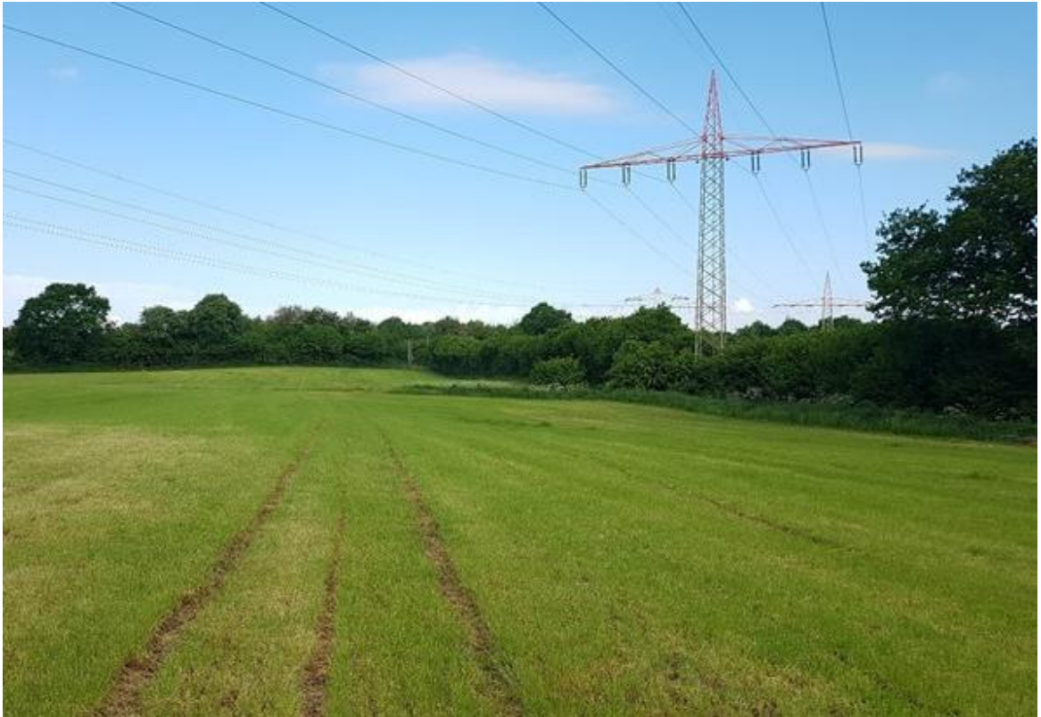
Abb. 2.5 Strommasten südwestlich des Vorhabengebietes (Blickrichtung: Nordwesten, Datum: 26.05.2025).