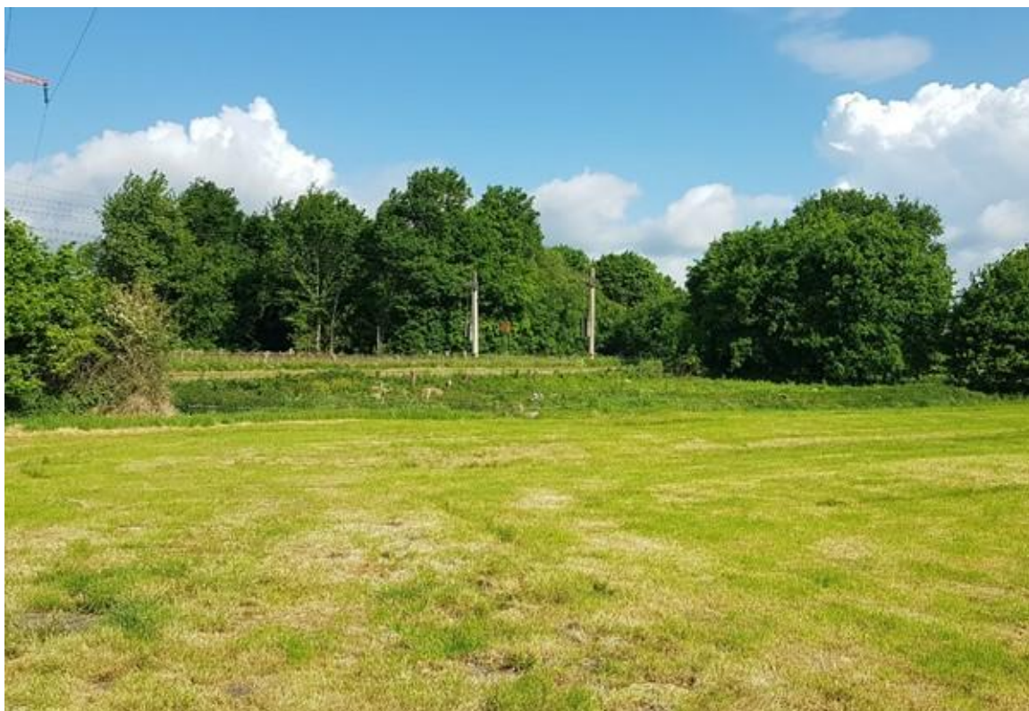
Abb. 2.4 Bahnlinie westlich des Vorhabengebietes (Blickrichtung Westen, Datum: 26.05.2025).