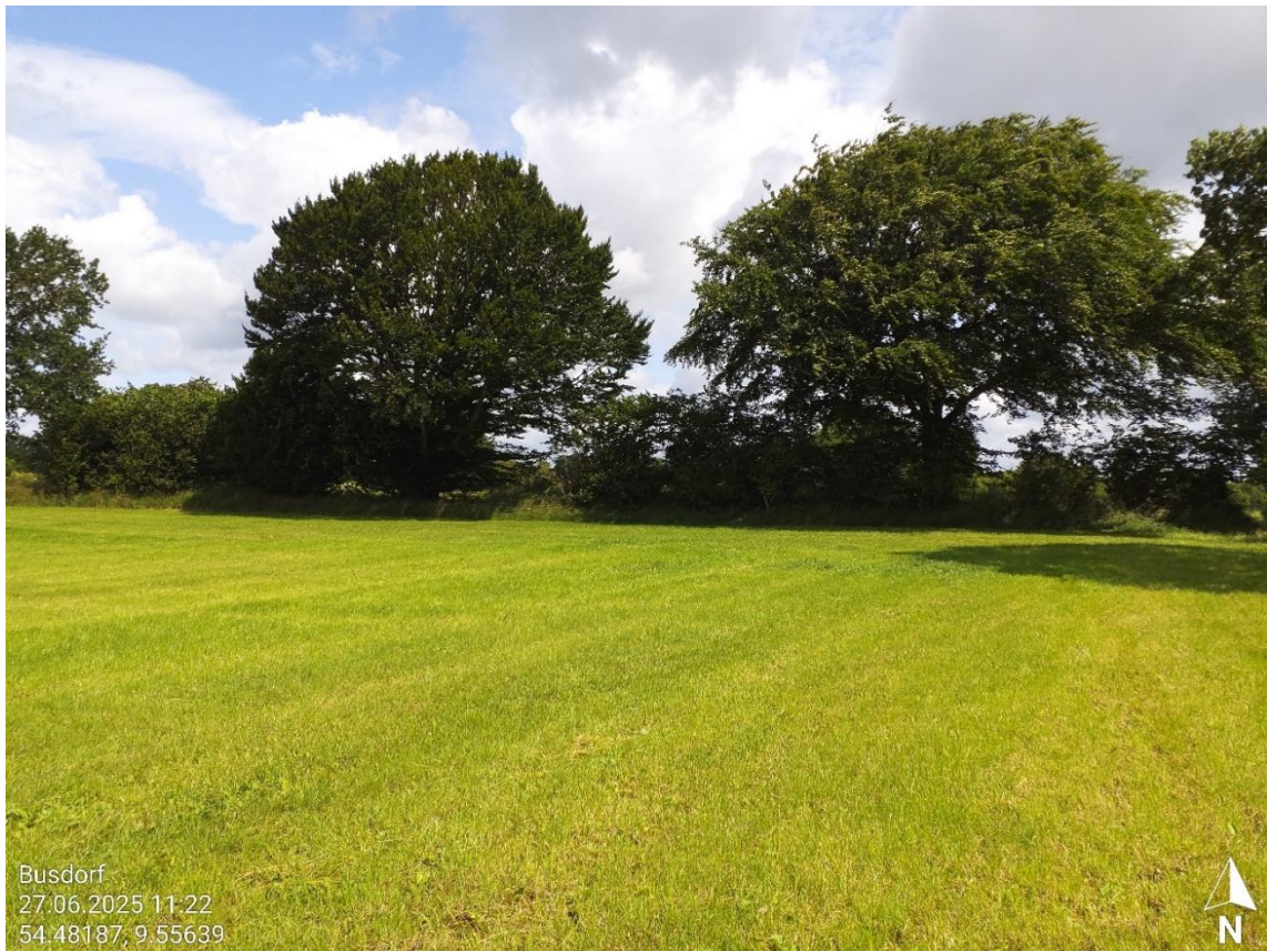
Abb. 2.3 Knickstruktur an der nördlichen Grenze des Vorhabengebietes.