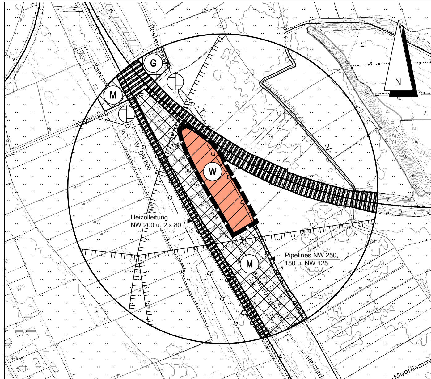
Kreis Dithmarschen - Gemeinde Sankt Michaelisdonn und Gemarkung Hopen, Flur 6

DTK5 © LVermGeo SH (www.LVermGeosh.Schleswig-Holstein.de)