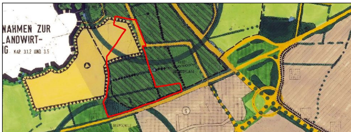
Abb. 1: Landschaftsplan Schleswig und Plangebiet

Der Landschaftsplan der Stadt Schleswig (1990) stellt im Bereich des bestehenden Betriebsstandorts der ASF eine Aufschüttungsfläche der Abfalldeponie dar. Für die umgebenden Flächen wird eine extensive Bewirtschaftung bzw. Pflege vorgeschlagen. Dabei gehört der nördliche Raum Haferteich, als übergeordnetes Entwicklungsziel, zu einem Entwicklungsschwerpunkt für Maßnahmen zum Schutz, zur Pflege und zur Entwicklung von Natur und Landschaft und von der Erholungsnutzung, für den mittelfristig Maßnahmen zur Extensivierung der landwirtschaftlichen Nutzung empfohlen werden. Der Landschaftsplan stellt im Plangebiet zudem ein Waldstück, ein vorhandenes Knicknetz sowie Vorschläge für Knickneuanlagen dar.