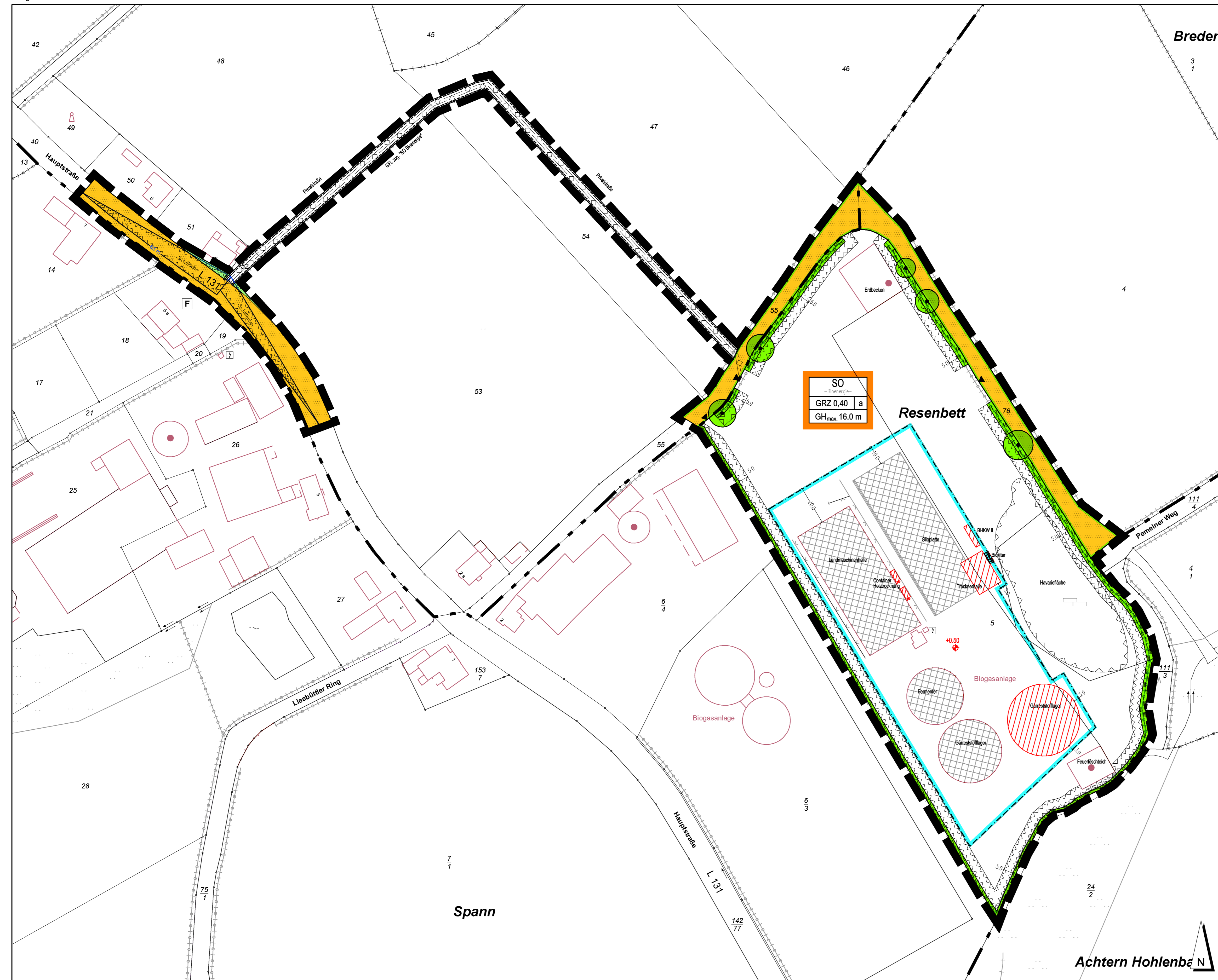
Kreis Rendsburg-Eckernförde - Gemeinde Steinfeld - Gemarkung Liesbüttel - Flur 2; Gemarkung Steinfeld - Flur 4