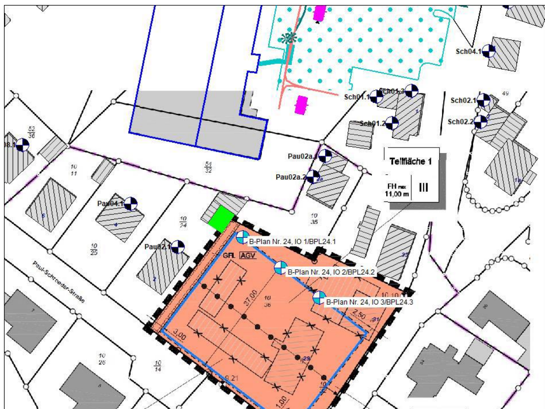
(Quelle: WVK, Lärmtechnische Untersuchung zur Aufstellung des B-plans Nr. 24 der Gemeinde Dänischenhagen)

Die Nacht ist aufgrund der nur in Betrieb befindlichen Haustechnik irrelevant für die Beurteilung.“