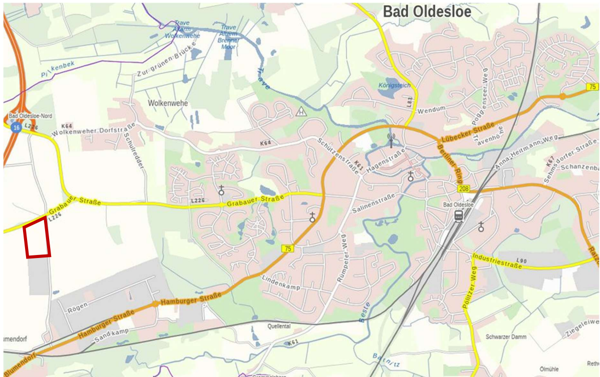
Abbildung 1: Lage des Vorhabenstandortes (rot umrandet), Kartengrundlage Digitaler Atlas Nord