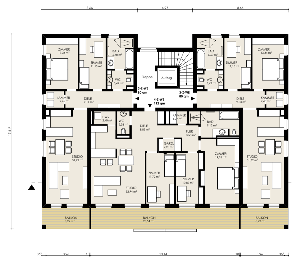
M 1_200 _OBERGESCHOSS_2.2