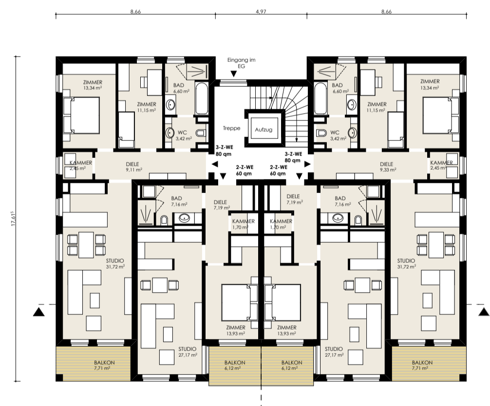
M 1_200 _OBERGESCHOSS_2.1