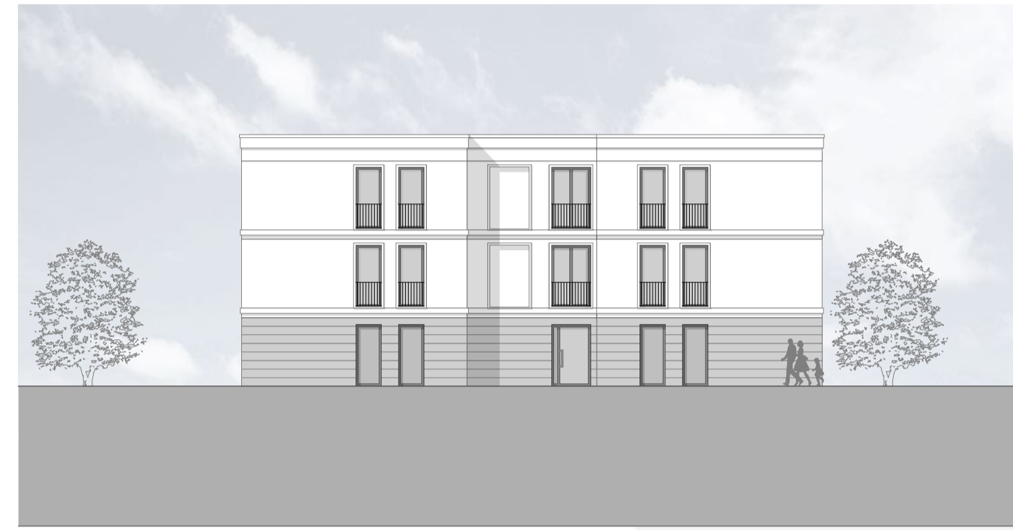
M 1_200 _ANSICHT_NORD