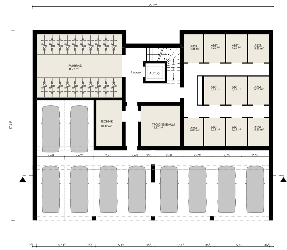
M 1_200 _UNTERGESCHOSS