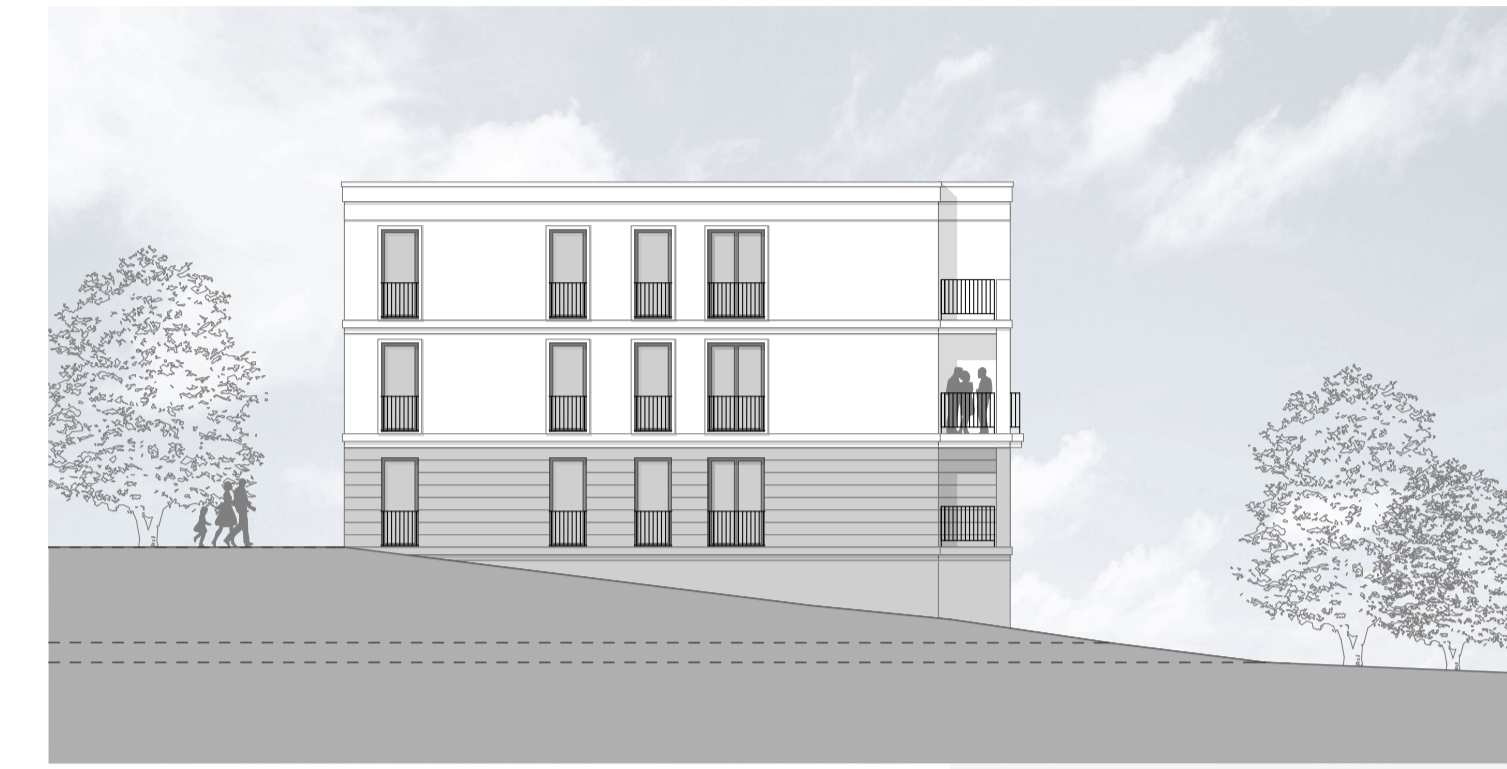
M 1_200 _ANSICHT_WEST