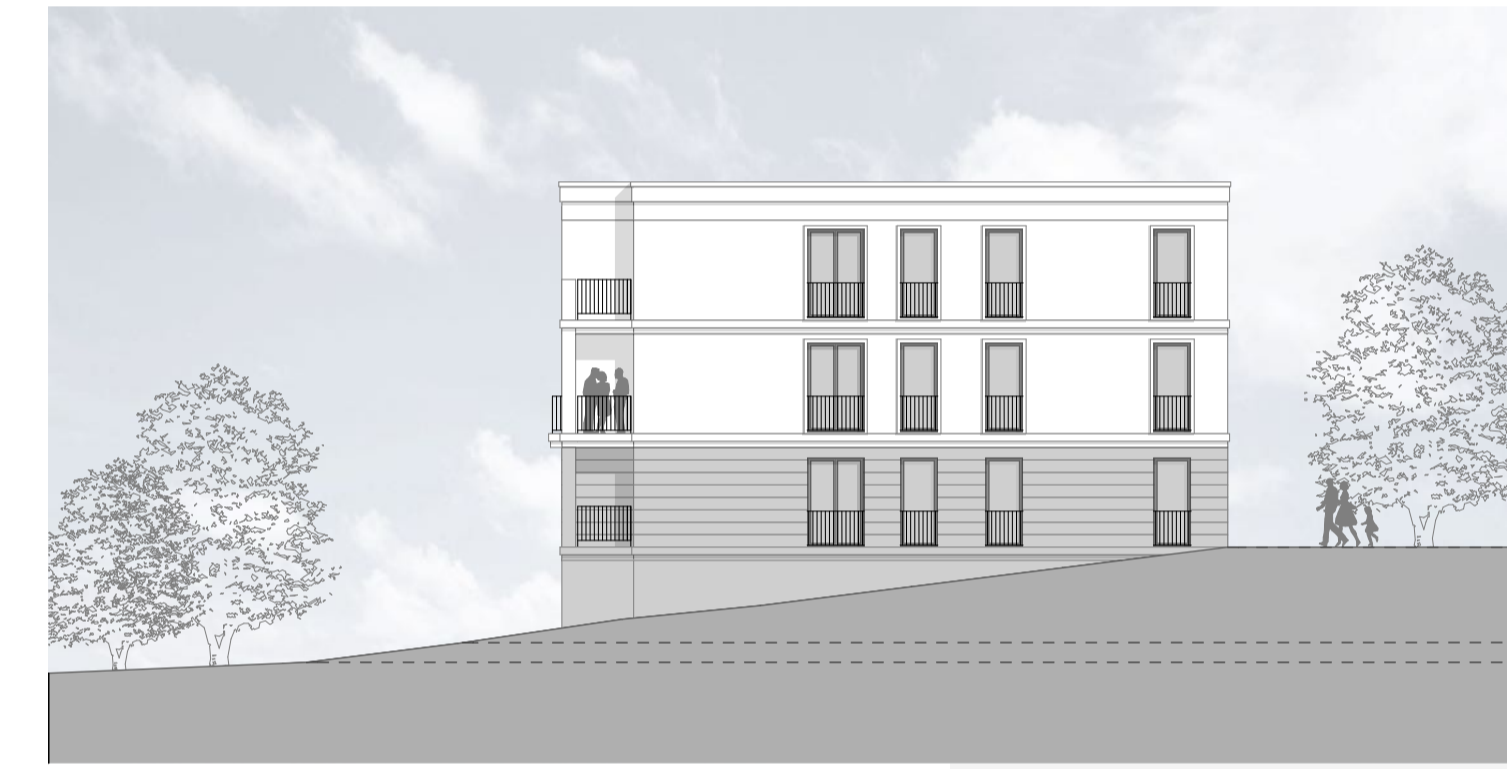
M 1_200 _ANSICHT_ÖST