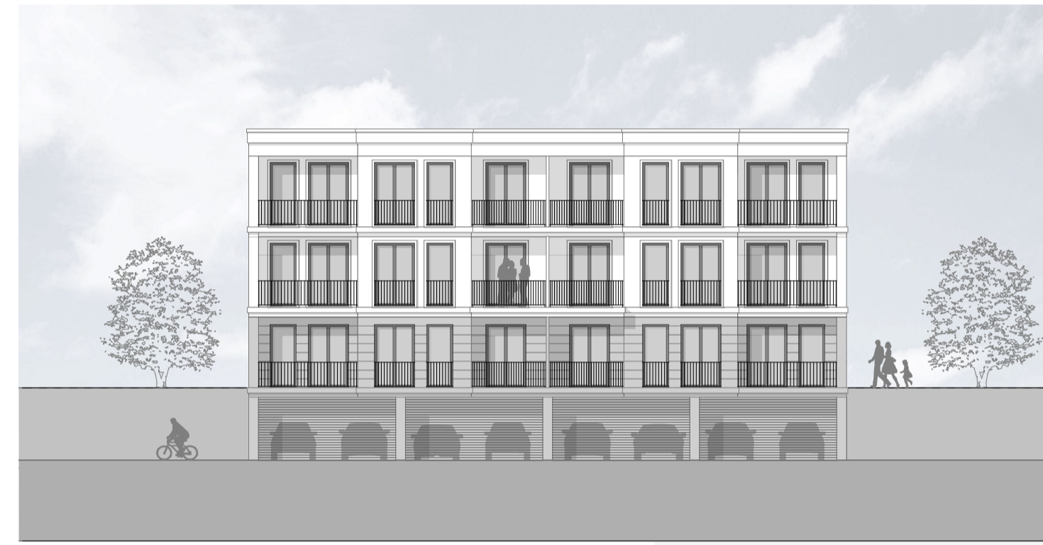
M 1_200 _ANSICHT_SÜD