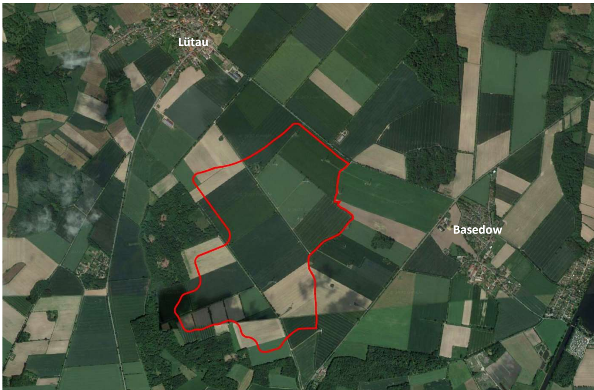
Abbildung 1: Luftbild mit Lage des Plangebietes der 5. Änderung des FNP, ohne Maßstab, (Quelle: Google Earth, 2020, © 2009 GeoBasis-DE/BKG).