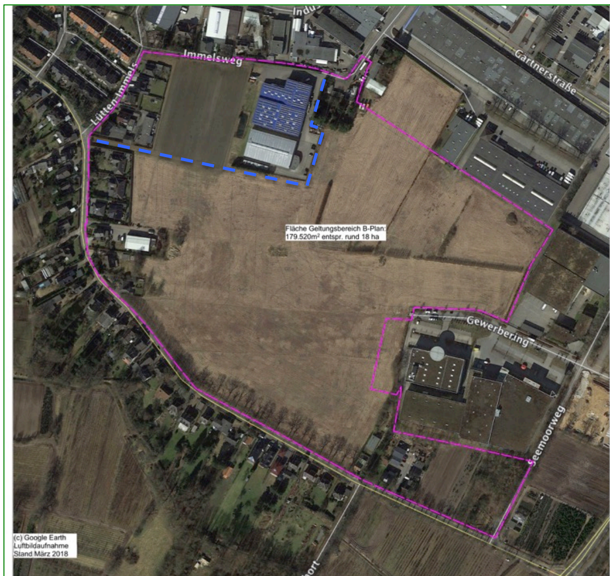
Abb. 1: Geltungsbereich heutiger B 62 (Umgrenzung pink) und ehemaliger B 62A (blau)

Das Planverfahren für den Bebauungsplan Nr. 62A (B 62A), der für die dringend benötigte, dann jedoch auf einem anderen Grundstück realisierte Erweiterung eines Gewerbebetriebes aus dem Geltungsbereich des Bebauungsplans Nr. 62 (B 62) herausgelöst wurde, ist Anfang 2018 nach den frühzeitigen Beteiligungsverfahren eingestellt worden. Der ca. 3 ha umfassende ehemalige Geltungsbereich des B 62A ist dann wieder in den Geltungsbereich des B 62 integriert worden (siehe folgende Abbildung 1).