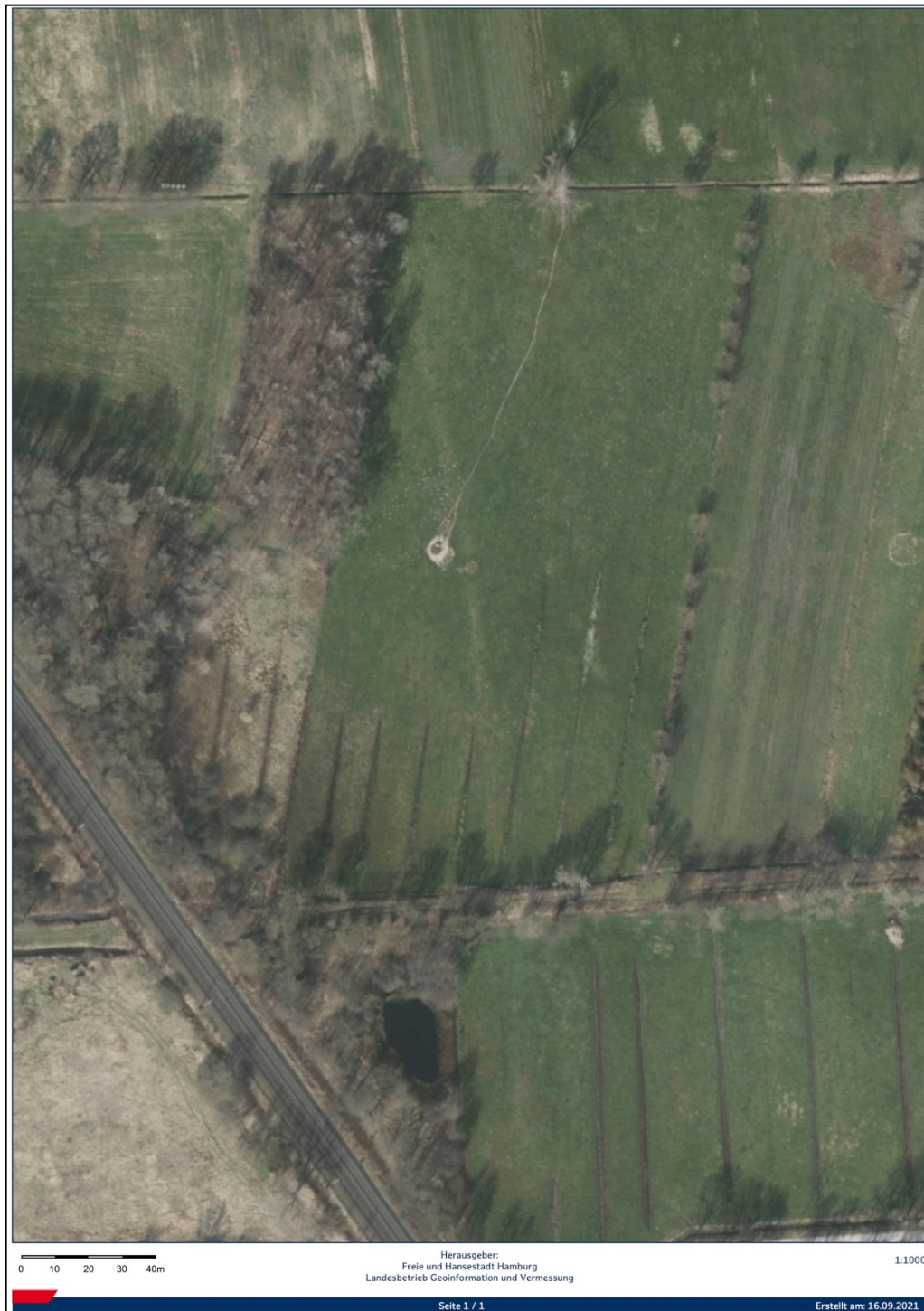
Abb. 3: Luftbild der externen Ausgleichsfläche Flurstück 47/1