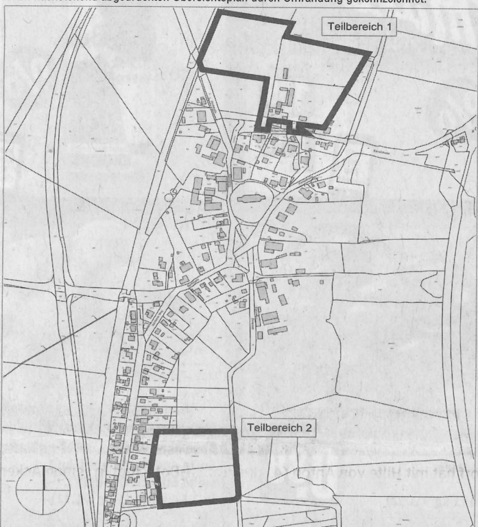
Der Geltungsbereich des Bebauungsplanes Nr. 3 „Nördlich und östlich des Friedhofes“ der Gemeinde Siebeneichen ist im nachstehend abgedruckten Übersichtsplan durch Umrandung gekennzeichnet.