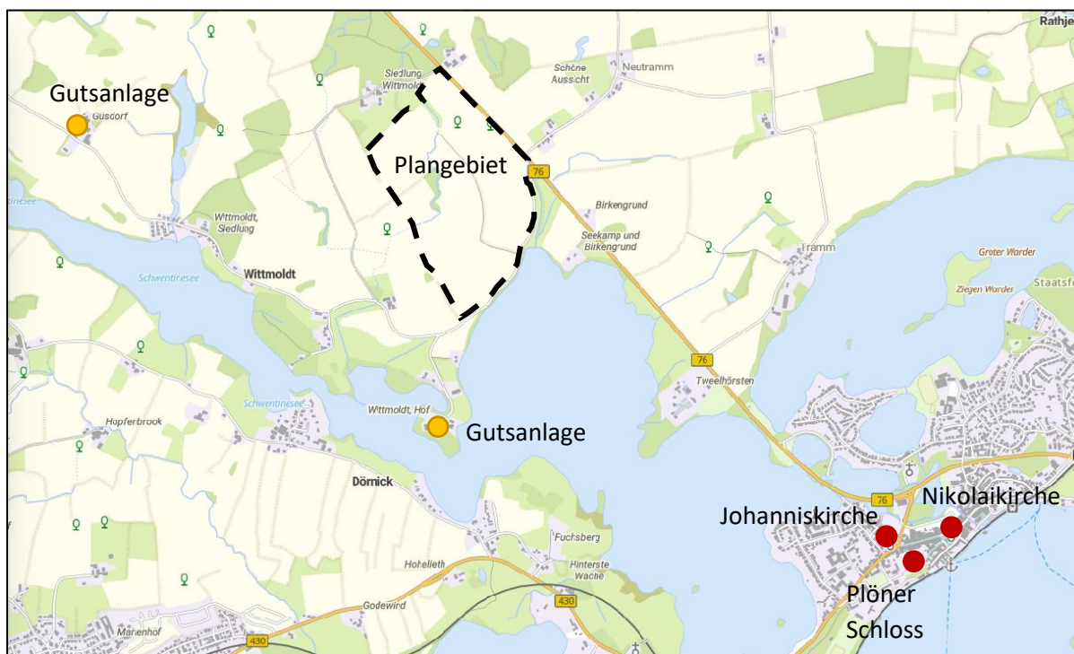
Abbildung 1: Relevante denkmalgeschützte Gebäude im Umkreis der Solar-FFA, Quelle: Digitaler Atlas Nord.

Im Umfeld der geplanten Photovoltaikanlagen befinden sich einige denkmalgeschützte Gebäude und Anlagen von welchen z. T. eine Fernwirkung ausgeht. Diese werden in der Abbildung 1 verortet: