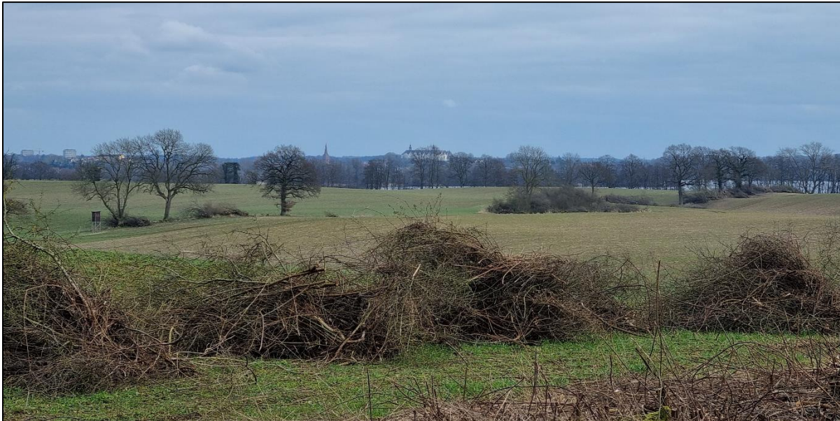
Abbildung 10: Blick vom Aussichtspunkt mit Bank aus nach Südosten, 3-fach Zoom, März 2023.