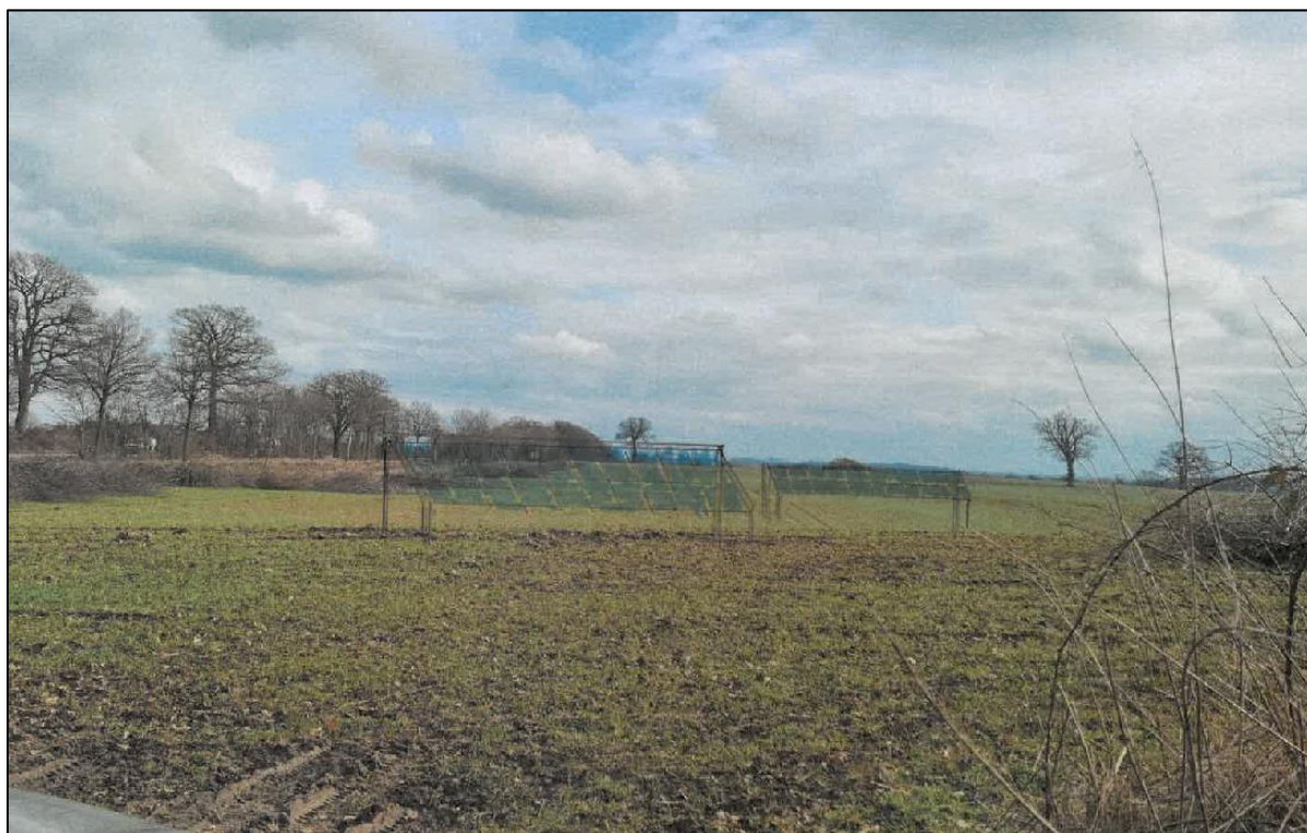
Abbildung 11: Standpunkt 1, Sichtachse auf Plöner Schloss mit schematisch dargestellten PV-Modulen.

Die geplante Photovoltaikanlage wird sich zukünftig am Standpunkt 1 und Standpunkt 3 (zzgl. des folgenden Wegeabschnitts) in die Sichtachse auf die Plöner Kulturdenkmäler schieben. Die Sichtachse vom Standpunkt 1 wird voraussichtlich durch die Solarmodule verdeckt werden. Vom Standpunkt 3 verändert sich hingegen eher die Aussicht in die Landschaft samt dem Schloss im Hintergrund: