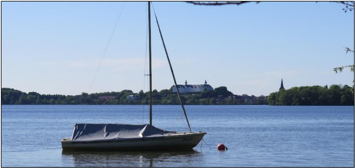
Abbildung 3: Blick zum Plöner Schloss vom Campingplatz Ruhleben aus, aufgenommen im Mai 2017 [ https://goo.gl/maps/FNvzvVauJqdJ7c3C6 , 31.03.2023]