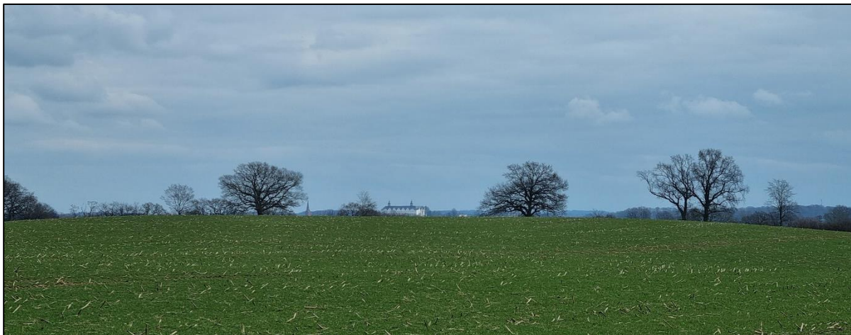
Abbildung 9: Blick vom Wanderweg aus nach Südosten, März 2023.

Auf dem nördlichen Abschnitt des parallel zum Plangebiet verlaufenden Wanderwegs ist punktuell das Plöner Schloss sowie die Spitze der Nikolaikirche über der Hügelkuppe zu sehen. Die Flächen des Plangebietes sind allerdings nicht zusehen, sondern lediglich die Kronen der Überhälter des Knicks am westlichen Rand des Plangebietes.