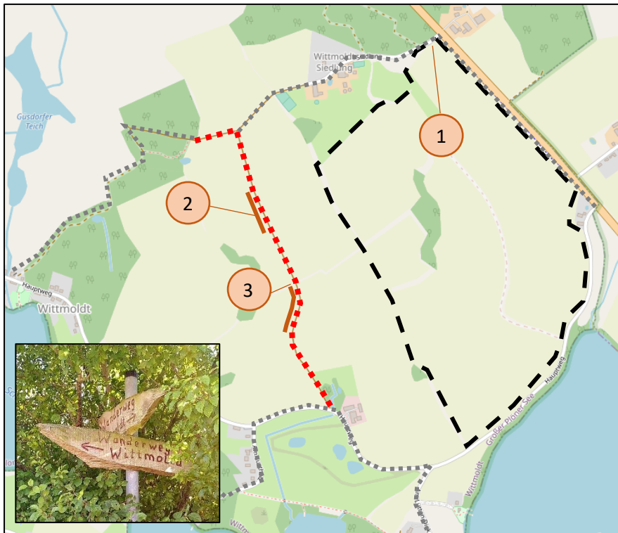
Abbildung 7: lokaler Wanderweg östlich des Plangebietes (rot gepunktet), Quelle Kartengrundlage: openstreetmap.org

Östlich des Plangebietes führt ein ausgeschilderter Wanderweg in ca. 250 m Entfernung parallel zum Plangebiet entlang (s. Abb. 7: rot-gestrichelte Linie). Dieser schließt zum einen an die Straße „Siedlung“ nördlich des Plangebietes sowie an Fußwege in Richtung der Ortslage Wittmoldt und des Gutes Wittmoldt an (s. Abb. 7: grau-gestrichelte Linie). Von diesem Weg aus ist das Schloss Plön abschnittsweise zu sehen. Hervorzuheben ist dabei der Punkt 3 (s. Abb. 7), welcher am Ende des öffentlichen Weges (nach Süden bis zum Hauptweg handelt es sich um einen Privatweg) einen Aussichtspunkt bildet und an welchem auch Sitzmöglichkeiten zur Verfügung stehen.