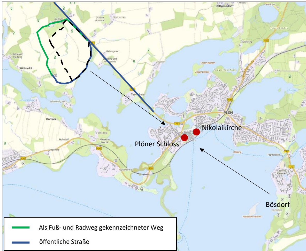
Abbildung 2: Wege und mögliche Sichtachsen um die relevanten Plöner Kulturdenkmäler herum, Quelle Grundlagenkarte: Digitaler Atlas Nord.

Eine Zusammenschau zwischen Solaranlage und den Plöner Kulturdenkmälern ist unter Einbezug der Topographie einerseits von den öffentlichen Wegen und Straßen im Umfeld um die geplante Solaranlage sowie von der Gemeinde Bösdorf und Umfeld aus denkbar.