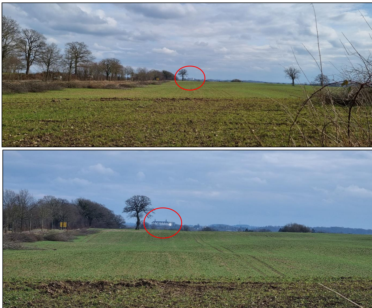
Abbildung 8: Blick von der Straße Siedlung aus über die Plangebiet nach Südosten, Bild unten 3x digital Zoom; März 2023.

Unmittelbar nach der Abfahrt von der B 76 in die Straße „Siedlung“ befindet sich eine Feldzufahrt. Von dieser aus ist das Plöner Schloss über der Hügelkuppe deutlich sichtbar. Es handelt sich jedoch um eine Blickbeziehung von einem relativ neuen Siedlungsweg aus (keine historische Wegebeziehung), welche durch eine zufällig angeordnete Feldzufahrt entsteht. Entsprechend ist gem. der Stellungnahme des Landesamtes für Denkmalpflege vom 30.06.2023 eine Verstellung der Sichtbeziehung zugunsten des Belanges „erneuerbare Energien“ nicht zu einem bei anderer Sachlage erforderlichen „Ausschluss“ der PV-Freiflächenanlage führt.