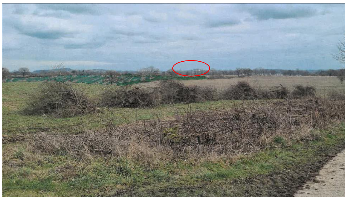
Abbildung 12: Standpunkt 3, Sichtachse auf Plöner Schloss mit schematisch dargestellten PV-Modulen.

Insbesondere bei der Betrachtung des Blickpunktes 3 sind die das Stadtbild Plöns dominierenden Kulturdenkmale „Schloss“ und „Kirche St. Nikolai“ im Zusammenspiel mit der Landschaft gut erkennbar. Allerdings ist am Standort 3 hervorzuheben, dass die Sichtbeziehungen zu den Kulturdenkmalen derzeit insbesondere bestehen, weil die unmittelbar den Wanderweg begrenzenden Knickstrukturen kürzlich auf den Stock gesetzt wurden und die Baumkronen noch nicht belaubt sind.