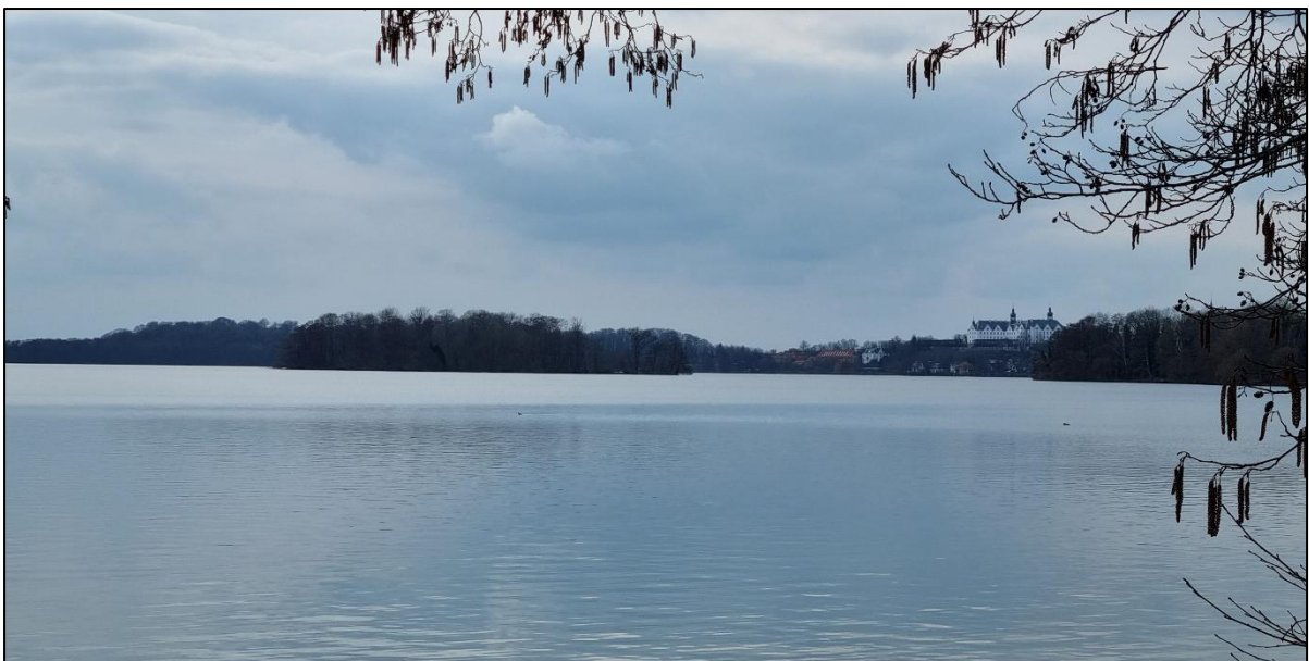
Abbildung 4: Blick auf das Plöner Schloss von der Plöner Motorschiffahrt, aufgenommen im März 2023.