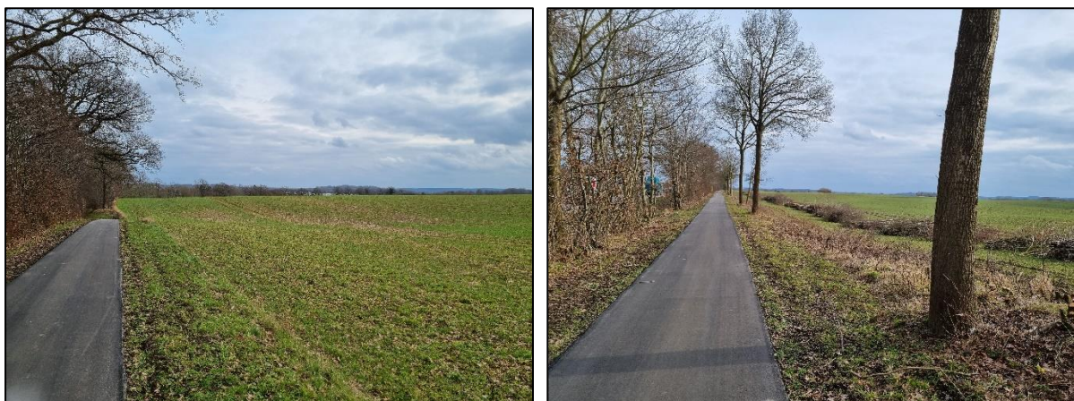
Abbildung 5: Blick vom Radweg nach Südosten, März 2023

Das Plangebiet wird nach Westen durch die B 76 begrenzt. Da die Plöner Innenstadt mit Schloss und Nikolaikirche in direkter Linie der B 76 gelegen sind und die Fläche des Plangebietes in weiten Teilen höher liegt als die Straße, entsteht keine Zusammenschau von Flächen des zukünftigen Solarparks und den betrachteten Kulturdenkmälern. Dieselbe Aussage trifft auf den Fuß- und Radweg entlang der B 76 zu.