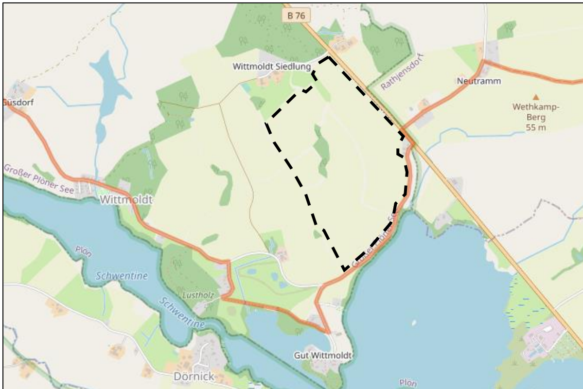
Abbildung 6: Verlauf des Europawanderweges E1 südlich des Plangebietes (orangenes Linie).

Aus Rathjendorf kommend, quert der Europawanderweg „E 1“ die B 76 und verläuft anschließend südlich des Plangebietes auf der Straße „Hauptweg“ und auf Fußwegen entlang der Schwentine. Vom Wanderweg aus ist das Plöner Schloss punktuell durch die Gehölz zu erkennen. Aufgrund der Lage des Weges südlich bzw. südwestlich des Plangebietes wird jedoch keine Zusammenschau der zukünftigen Solarmodule mit den Kulturdenkmalen Plöns entstehen.