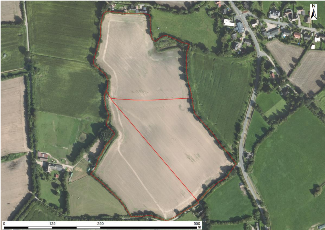
Abbildung 2: Luftbild des Vorhabengebietes